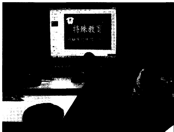
■ 特教宣導——布丁狗的心聲（一）。

瞭解特教範疇及認知，使特教融合教育更落實於校內，發揮協助班上弱勢同學的功效。本校特教組設計了二個教案，並製作2小時的教學簡報光碟，由各班導師親自於班上教學。在施作過程中所需使用單槍投影機等器材設備及場地的問題，由行政事前先做足溝通與協調。