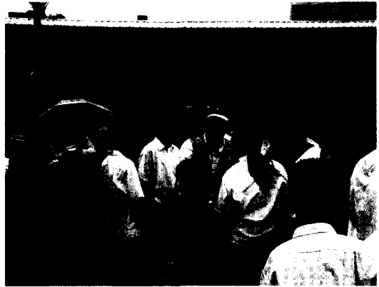
■ 自來水博物館同仁為本校學生導覽。