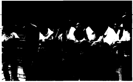
■ 學生參訪自來水博物館專注神情。

為了讓學生瞭解「水」與生命的關係並能珍惜水資源，本校「自然與生活科技」領域以「水」為主題，設計領域教學活動，因此在生命教育彈性課程中安排參觀水資源博物館，參觀過程中先由導覽員進行解說，然後自由參觀淨水設備等。