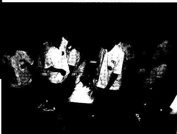
■ 「宇宙之門」培養團隊合作的默契。

這個課程我們請中華探索教育發展協會的訓練員來本校帶領這個活動。導師擔任觀察員，並需填寫課程觀察記錄，課程時間為3小時。整個課程的進行方式為遊戲、討論、省思，目的在使學生從團體中的衝突到追求共贏的過程中，體會到合作與團結的重要性。