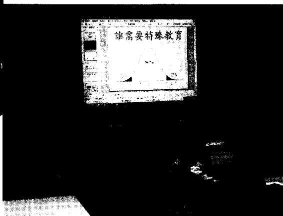
■ 特教宣導——布丁狗的心聲（二）。