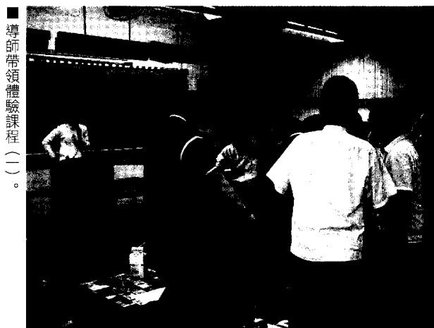
■ 導師帶領體驗課程(一)。

驗生命教育的內涵，並且培養出更好的基本能力，這雖是一項極大膽的嘗試，但也是九年一貫課程所標榜的教育鬆綁與尊重教師專業的最實質做法。