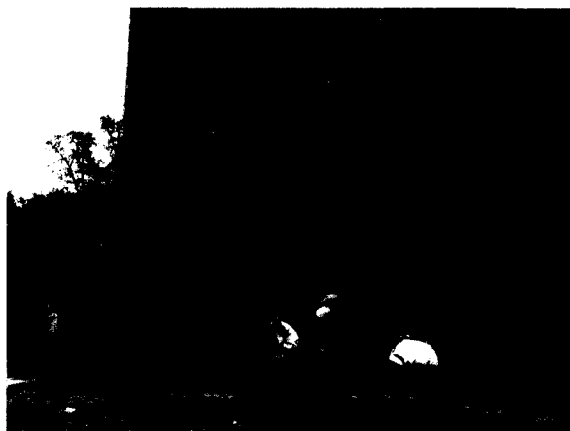
■ 透過攀岩培養學生冒險犯難的精神。