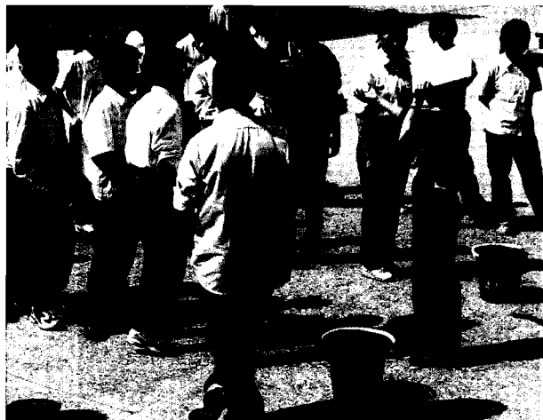
■ 導師帶領體驗課程(二)。