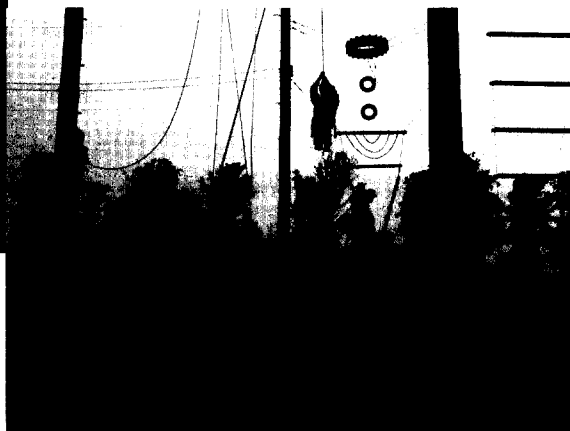
■ 透過「大擺盪」培養學生挑戰的精神。