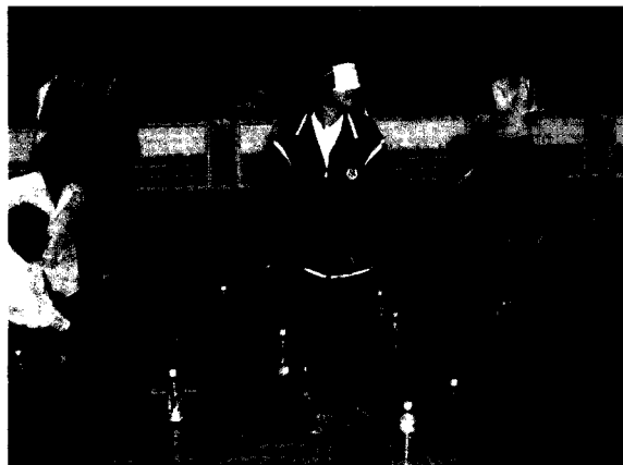
■ 讓學生體驗失明的滋味進而培養同理心。