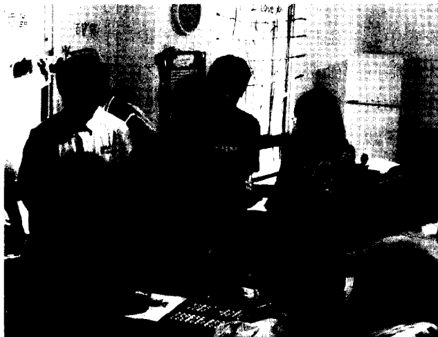
■ 學生慰問真光教養院院童。

輔導室在參觀之前即與導師聯繫可以請同學帶玩具、食品去贈送給院生，或帶衛生紙等日常用品送給院方，在現場學生都把贈品全數分贈。