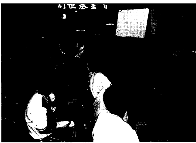
■ 學生專注的聆聽創世基金會義工簡報。