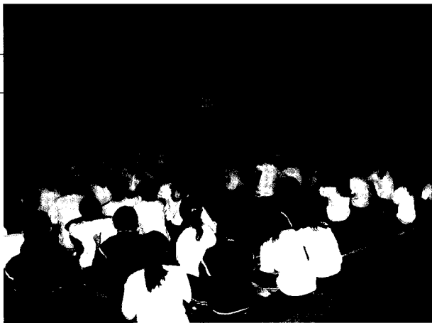
■ 學生專注聆聽生態之美幻燈片簡介。