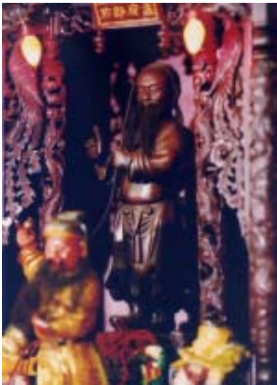
圖 31：南聲社郎君爺像一

先賢圖中之內容，並且也詳實的記載了歷代南聲社的負責人及館先生。此一內容也同樣為南管文化圈中各館閣先賢圖之內容；較早之前由於南管文化圈中之樂人，通常其所教之館閣並非只有一館，因此有許多館閣之先賢圖中，也會有同一南管樂人之名，寫於其圖上。