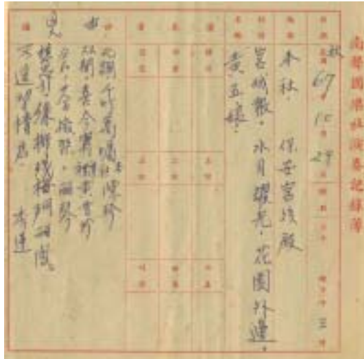
圖 29：南聲社秋祭演奏記錄一（1988 年 10 月 29 日）