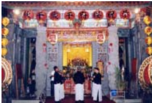
圖 42：於臺南碧龍宮為五府千歲安座祭祀整絃（2004 年 6 月 12 日）

在這之中也有一些屬於例行性的活動，其一：大約於 1999 年開始，南聲社皆會於臺南市的南鯤鯓震靈壇為其壇中之吳、池、朱府千歲舉行祝壽儀式暨整絃排場，此祝賀活動原為位於南鯤鯓之館閣群鳴社所施行，但由於其館當時已解散，而其成員蘇榮發老師、陳進財先生、陳新發先生及陳秋旭先生也於其散館後進入南聲社活動，因此其祝壽活動就此以後就由南聲社所替之舉行；然而，其每年整絃排場暨祀神為其神明祝壽時，其廟方旁邊通常也皆會請歌仔戲出團「扮仙」或是於晚上 11 點祭祀前請道士為之做法。其二：每年農曆 2 月 2 日南聲社皆會於臺南市和緯路上的王家，為王府王爺誕辰進行祝壽之儀式及整絃排場，其開始之正確時間並未知曉，但南聲社之樂人們僅記得是從金聲社時期就一直持續到現在。