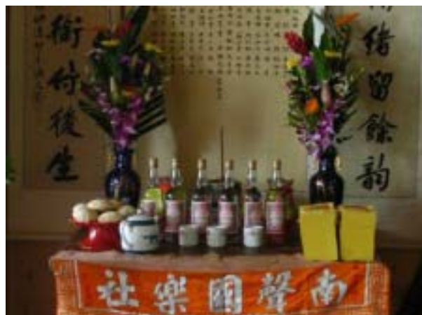
圖 37：南聲社祭拜先賢之祭品