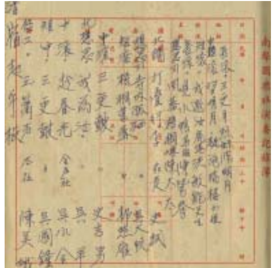
圖 30：民 67/10/29 南聲社秋祭演奏記錄二（1988 年 10 月 29 日）（南聲社提供）