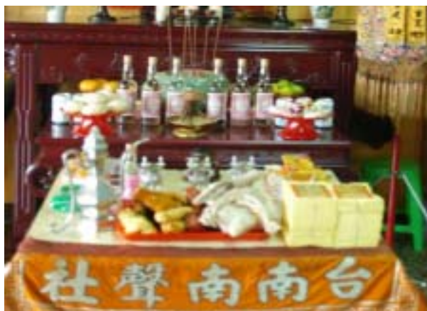
圖 36：南聲社祭拜郎君爺之供品

因此祭祀時獻孩子，就象徵其賜人子孫，及多子多孫之意。就呂錘寬老師所言，其五牲等同於三牲，因為其內容均為胎生、卵生及水產類各一，只是現今各類祭品之眾說紛云，故筆者於此文中，依舊採用南管文化圈所使用之說法。