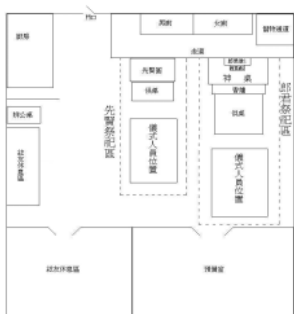
圖 41：南聲社於夏林路館址之郎君祭儀式空間圖