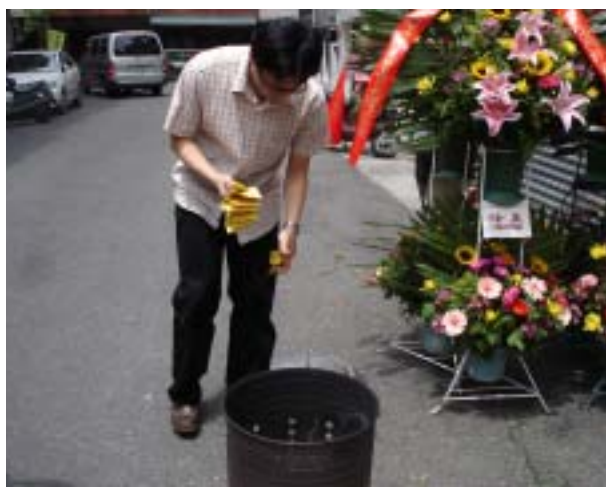
圖 34：郎君祭儀式節東後館員至館閣門口燒金紙、銀紙

南聲社郎君祭之音樂內容，同第一章所說，祀郎君演奏譜〈梅花操〉第一節開始至第二節，接唱曲【金爐寶篆】全曲，結束後接譜〈梅花操〉第三節至第五節，在譜〈梅花操〉演奏完畢之後，祀郎君儀式即到此告一段落。隨即稍作休息後，緊接著替換祭祀人員，開始祭先賢儀式，其樂隊同樣演奏譜〈五湖遊〉第一節，接曲【畫堂彩結】，結束後接譜〈五湖遊〉第二節至五節。至此，祭先賢儀式也告一段落，隨即則有館員於南聲社一樓門口處焚燒金紙、銀紙（圖 34）。隨後則會伴隨著整絃排場。