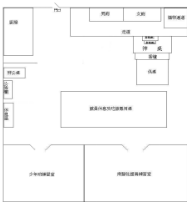
圖 40：南聲社於夏林路館址之館閣空間配置圖