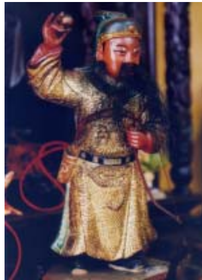
圖 32：南聲社郎君爺像二