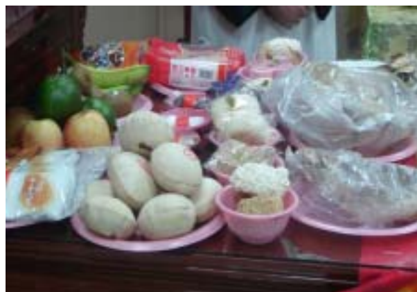
圖 39：振聲社祭拜郎君爺之供品

以南聲社來說，其所準備之供（祭）品也有分場合，較盛大之場合，和一般每年均需舉辦之春、秋二祭之祭品內容，也會有所分別，較盛大場面所準備之物品，以 2003 年於臺南市勞工育樂中心所舉辦之秋祭祭典來說，其內容分別為：東燈一對、副東燈二盞、正東雙層麵龜一個、插八仙、副東麵龜二個、春花百朵、孩兒百仙、煎料狀元糕百塊、五色弓彈三百粒、五菓、六齋、甜碟、五牲、清茶、敬飯、筵席足用、碗糕、麵龜、肉員、芋粽、三壽、紅員、金帛、花瓶、火燭一對、九金、大鈔、炮、荐盒、菓盒等。場面應用：點心的碟、鹹碟的碟、紙煙、厚煙、煙輦、火把、絃線...等（以上資料易南聲社提供）。