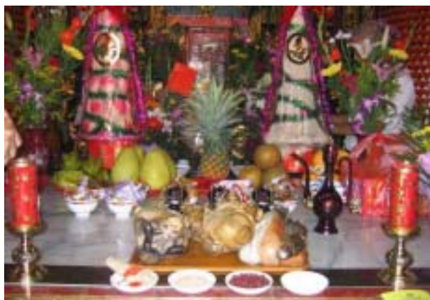
圖 38：合和藝苑祭拜郎君爺之供品