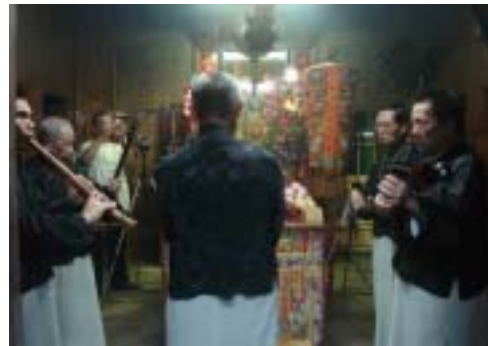
圖 43：於臺南震靈壇為吳府千歲誕辰祭祀儀式（2007 年 10 月 25 日）