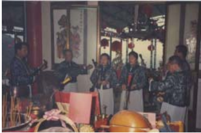
圖 44：於臺南南化鳳燕山金宗禪院祭祀觀音菩薩（1991 年 4 月 27 日）