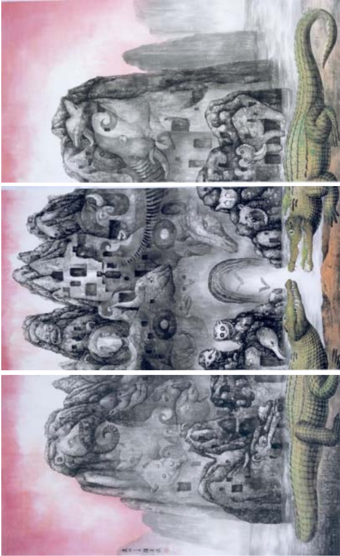
大魔島 2005 生宜、水墨賦彩 (三聯屏) 180 x 288 cm