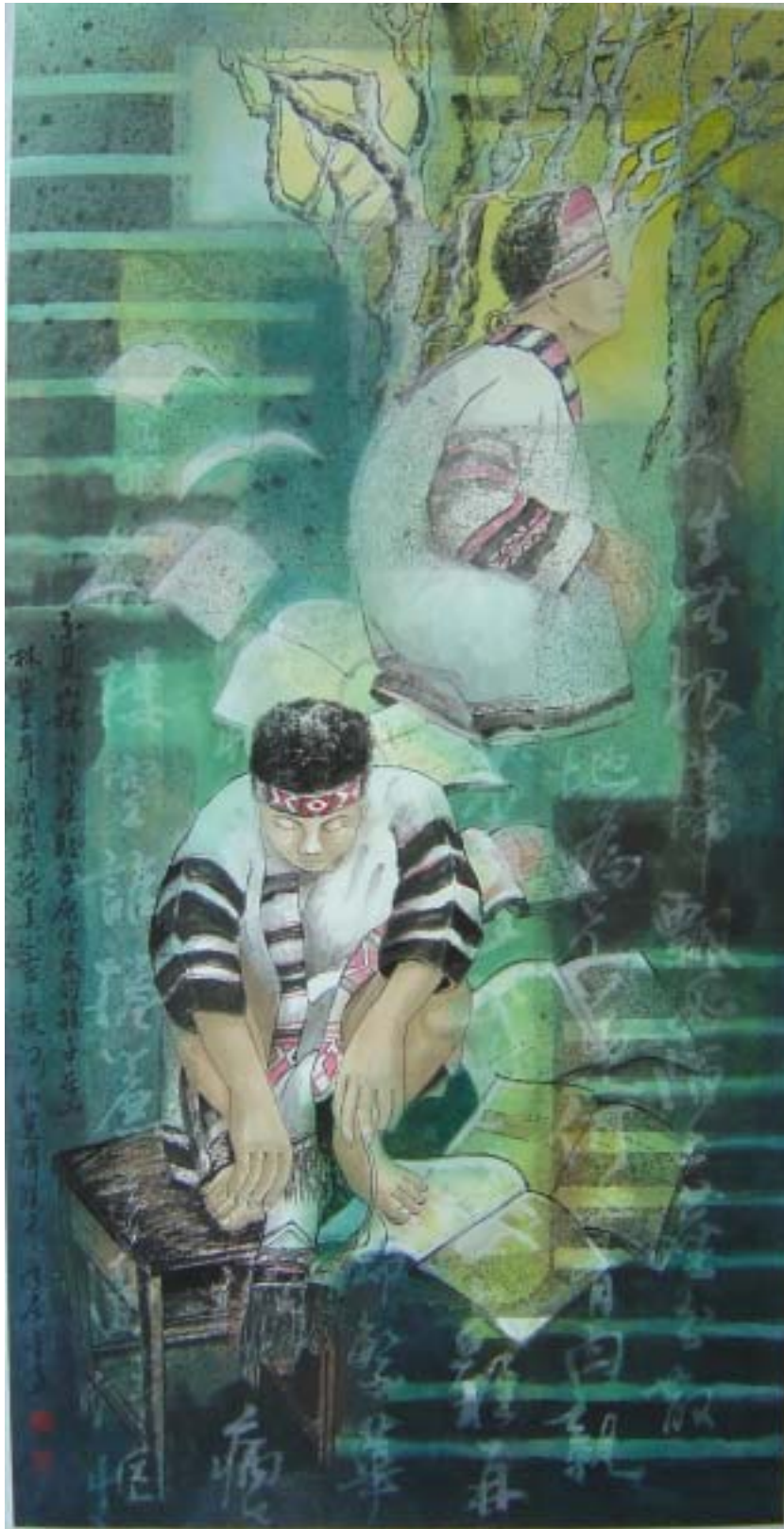
不見山林 [衝突系列三]