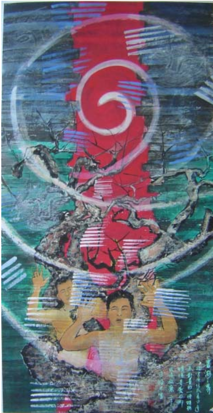
書海之界 [衝突系列一] 130 cm x 70 cm (2003) 紙本·設色