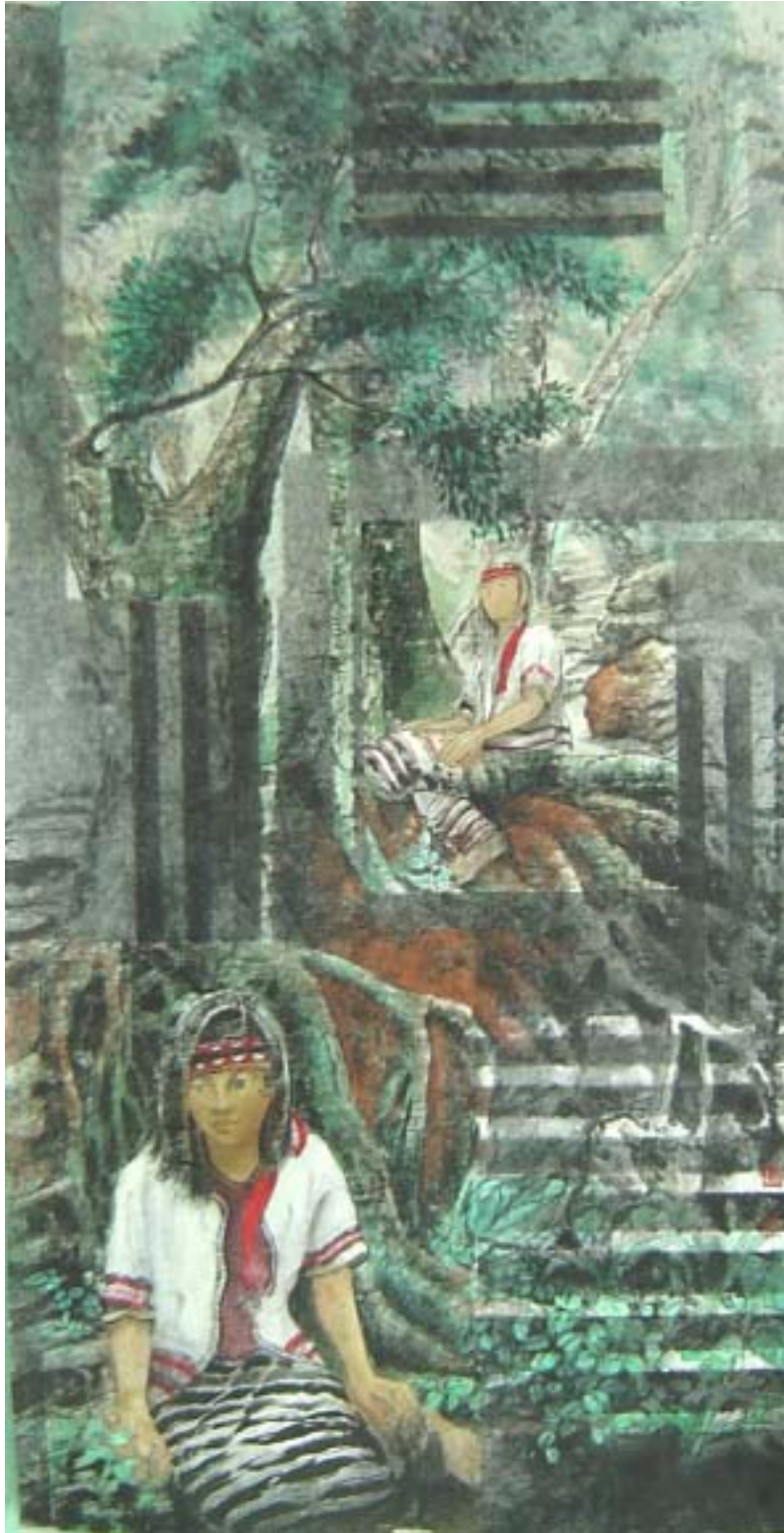
迷 I [寻找系列五]