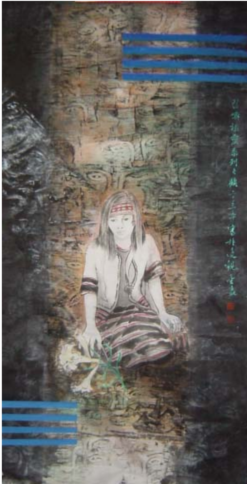
顧 [ 召喚祖靈系列二 ]