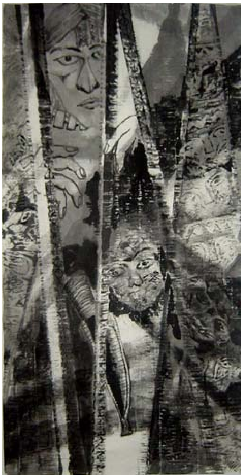
獵殤 II ( 召喚祖靈系列一 ) 130 cm x 70 cm ( 2003 ) 紙本 設色