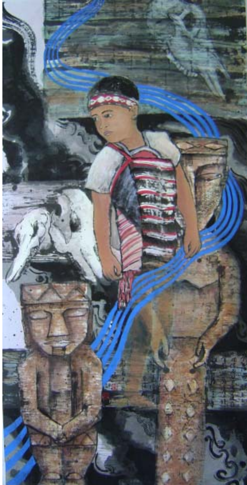
請問爸媽？〔衝突系列二〕 130 cm x 70 cm (2003) 紙本 設色