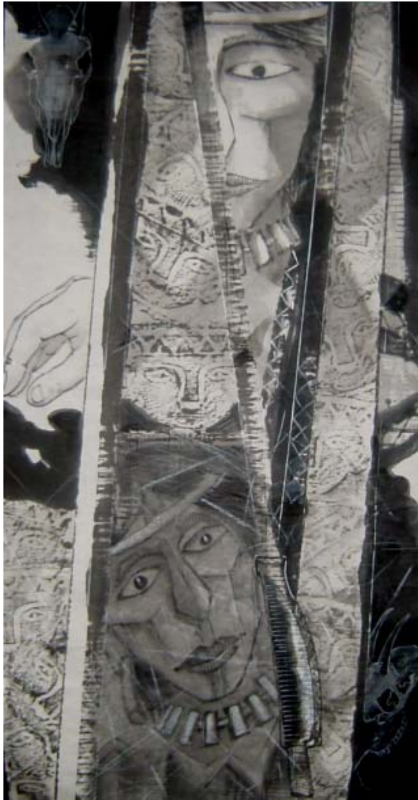
獵殤 I [ 召唤祖靈系列三 ]