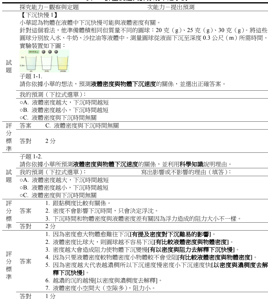
表 2 評量例題與評分規準之示例