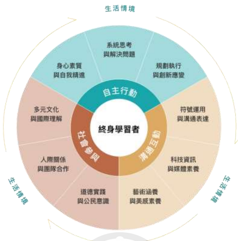
圖 5-1 核心素養的內涵（三面九項）（資料來源：108 課綱資訊網。）