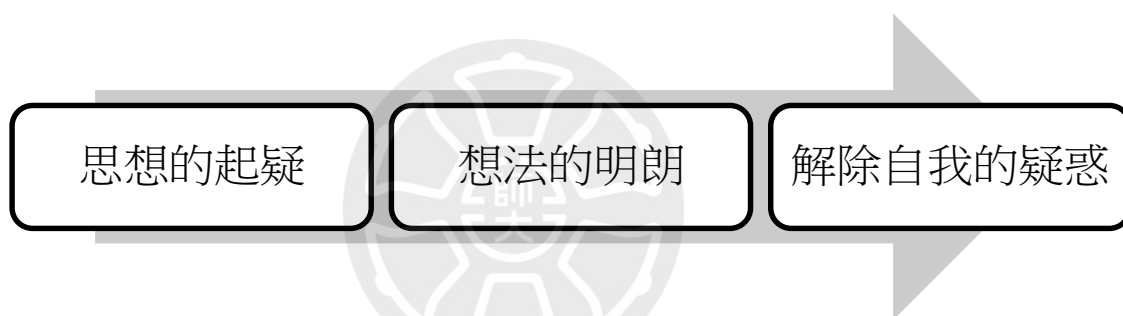
圖 2-1 南一版〈謝天〉課文賞析三層次

第一層次為「思想的起疑」 20 ，闡述探索其謝天隱含的意義；第二層次是「想法逐漸明朗」 21 ，描寫追尋答案的過程作者對於謝天的想法有了新的理解、豁然開朗；第三層次為「解除思想的疑惑」 22 ，當他體悟到謝天的真義時已是成年後，此時的陳之藩也是為社會服務的一群，此時的陳之藩既不否定傳統的習俗觀點，也對謝天二字賦予全新的定義。