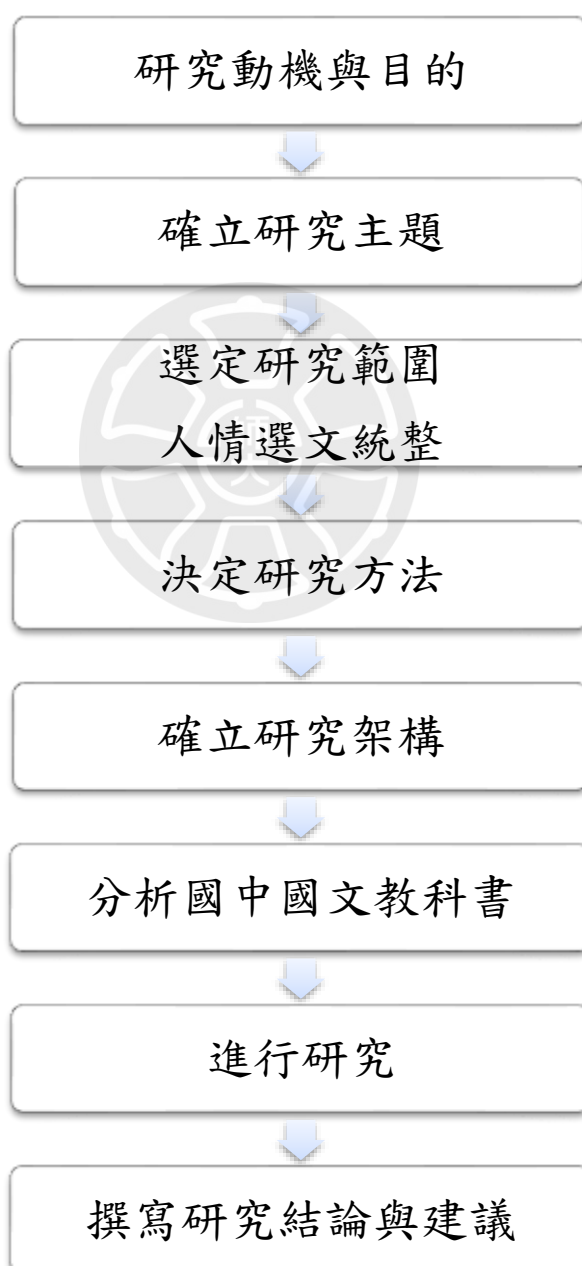
圖 1-2 研究流程圖