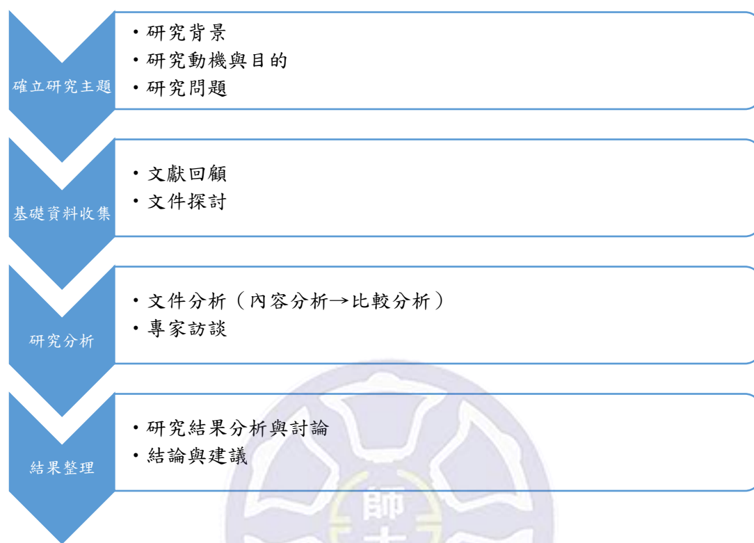
圖 2 研究流程圖

身工作領域對海洋教育目標及內容的看法，並針對本研究第一階段之修改建議提出建言，以完成本研究最終研究結果之建議。本研究完整研究流程之示意如圖 2。