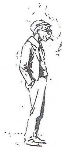
圖一 混合男孩 (Baden-Powell, 1908/ 2004:197)

在學的年輕學子相對於在社會中工作的年青人，不好運動，為了考試在學業上刻苦的學習，在《童子警探》中，貝登堡將此兩種角色混合描繪成一個奇怪的混合男孩(如圖一)，部分為努力向學的學生戴著他的帽子和眼鏡；部分工薪階層的浪費者，作出駝背的姿勢，嘴中叨根香煙並將手插在口袋裡。反智力和反城市 337 的結合恰好吻合貝登堡對學校的批判：學校漠視學生的體能和道德發展，卻專注和在意那 3Rs (Jeal, 2007: 358-359)。學校到底是個什麼地方？它的功能又是什麼？Rosenthal(1986:90)的答案是：公學校是給上流階層的孩子待的地方，他們的父母要有相當的財力，方能將子女送往的地方。換句話說，公學校僅開放給父母親財力足以負擔生活所需的孩童們。Rosenthal(1986:90)更指出，貝登堡認為學校應教育並給予年輕一代無私、自律、榮譽感、責任心、樂於助人、忠誠和愛國的精神，唯有這些精神才足以形成健全的品格，然而公學校受並無教導孩子這些，無論教師的指導方式有多專業。