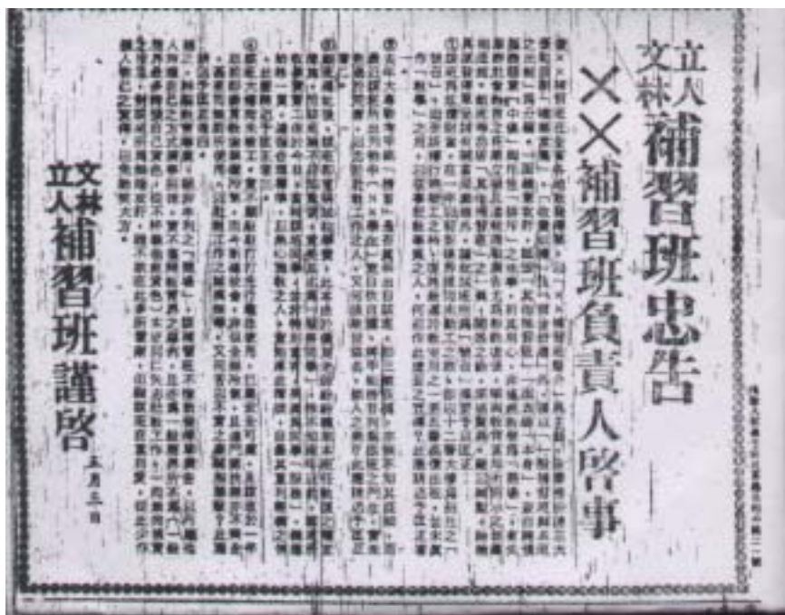
圖 3-3 立人及文林補習班「忠告」建國補習班負責人啟事

朱世衡等設立的立人補習班，於稍後的時間又改為「求實補習班」，招生情況良好， 62 許多學生慕名而來，招生不過三天就額滿。 63 而朱世衡本人在臺北市化學科老師中一直位居牛耳地位，影響力一直持續到民國六十年代中期，其移民國外以後。 64