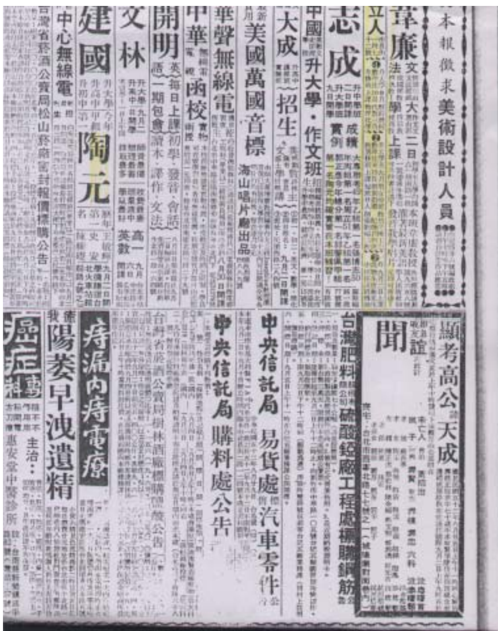
圖 3-1 建國與志成補習班報紙招生廣告