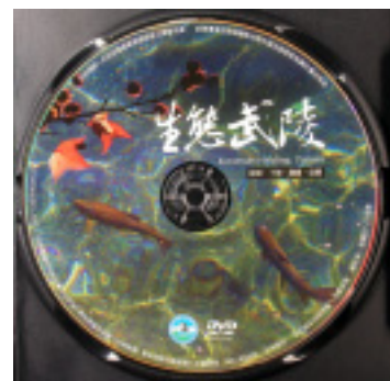
圖 1-1-5、《生態武陵》DVD 複合光碟