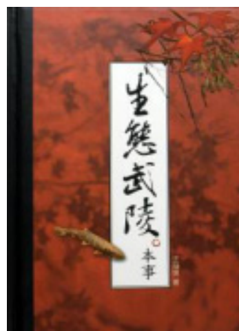
圖1-1-3、《生態武陵本事》書籍封面