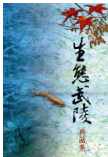
圖1-1-1、《生態武陵》典藏集盒套

《生態武陵》DVD複合光碟與《生態武陵本事》書籍，合為套裝的《生態武陵》多媒體教材。《生態武陵》多媒體教材是由雪霸國家公園管理處發行，可以作為武陵遊客中心的導覽，也可以作為生態旅遊及環境教育參與者教材之用(汪靜明, 2005a)。武陵地區位於雪霸國家公園境內，是旅遊勝地，也是子遺的國寶-台灣櫻花鉤吻鮭以及涵養許多生物關連的生態環境，更是曾經參與武陵共同的生命記憶與憧憬。雪霸國家公園管理處在武陵地區的環境教育推動上，基於其組織業務執掌的任務及解說教育數位化多媒體教材需求之考量，於2004年辦理「武陵環境生態多媒體教材暨生態教育推廣計畫」，並由台灣師大環境教育研究所汪靜明教授主持，漢笙股份有限公司李玉琥總監共同主持，進行武陵環境生態影片以及影像多媒體簡報之教