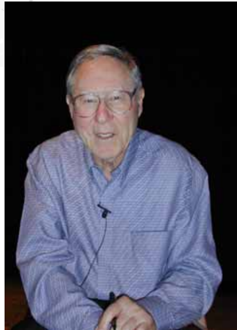
▲圖 2-1 William Glasser 近照

William Glasser 是以精神醫學起家之心理醫師，其現實治療理論是最為人所熟知的，此理論除了應用在精神醫學界、青少年犯罪問題以及一般情緒或適應困難者外，後期 Glasser 則轉向對教育問題的關切，並將其理論主張運用在學校教育及班級經營上。職是之故，要探討 William Glasser 的教育理念須從其現實治療理論談起，因其教育理念是從其現實治療理論衍生而來，因此，本章第一節首先介紹 William Glasser 的生平經歷與現實治療理論的發展；第二節介紹心理需求與內外控信念理論；第三節為現實治療之理論探究；第四節則為現實治療的相關研究之說明。