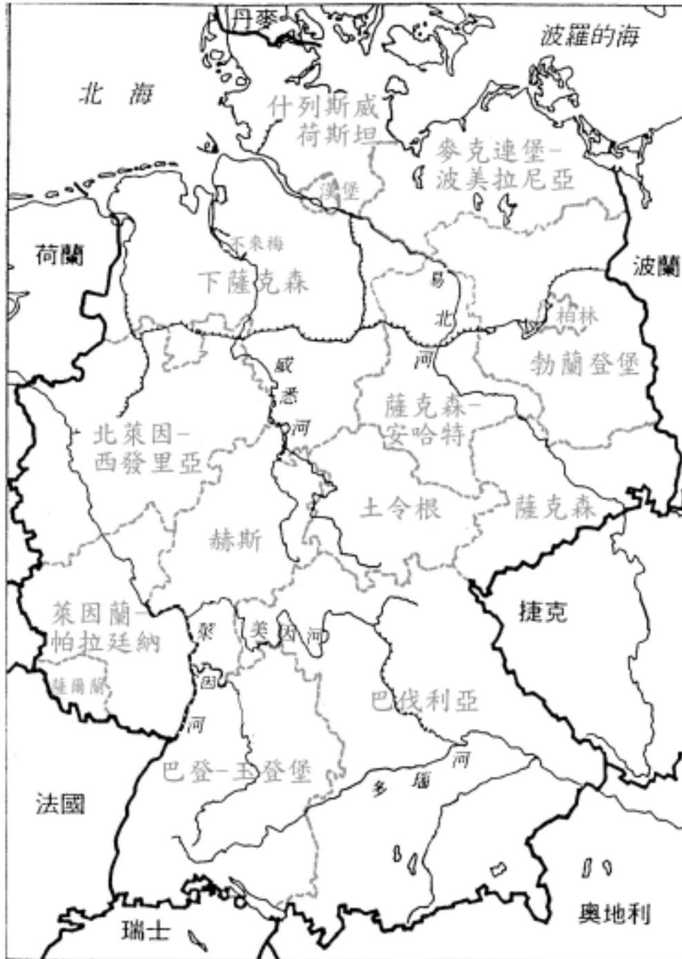
圖表 3-14 學習單三：德國作曲家尋根之旅，第 2 頁