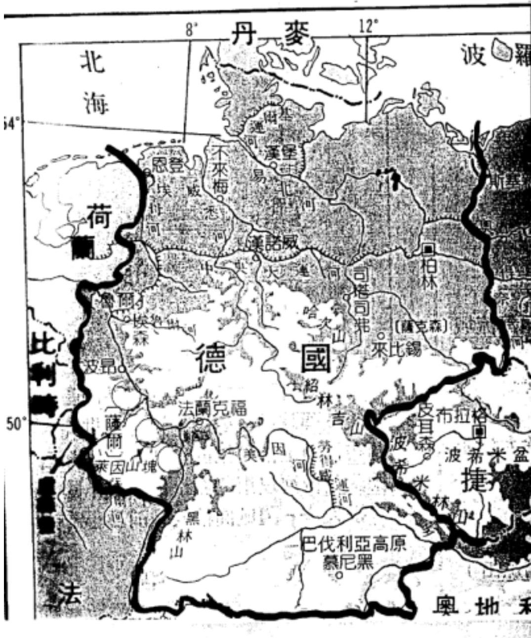
圖表 3-5 豐東國中音樂與地理統整教學實驗學習單，第 2 頁

資料來源：蔡文隆、蔡久瀛編繪〈國中外國地理圖表通鑑〉。台南市，南一書局。頁 36 一隅。