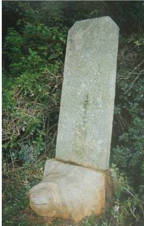
圖 3-13 黃偉龜趺式墓道碑