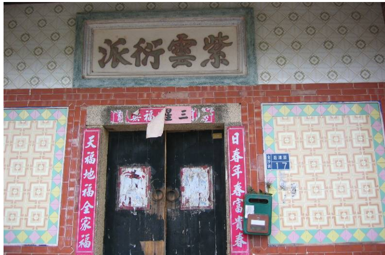
圖 3-1 紫雲衍派堂號

守恭知爲神人，慨然全部施捨，建寺曰「白蓮寺」，又因有紫雲蓋頂之祥，也稱之「紫雲寺」，迄開元間朝廷賜額「開元寺」。而後歷代子孫科甲聯芳，金門黃姓即以「紫雲衍派」（圖 3-1）爲堂號。 6