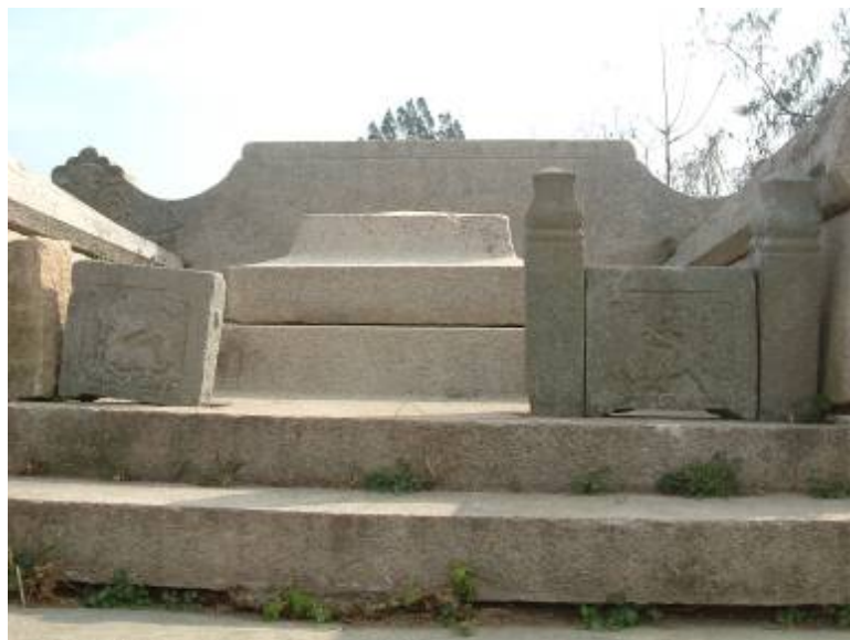
圖 3-11 型如方上覆斗式墓塚