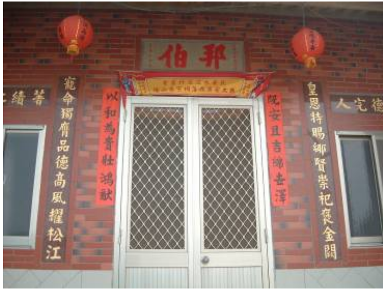
圖 3-8 黃偉故居之邦伯匾