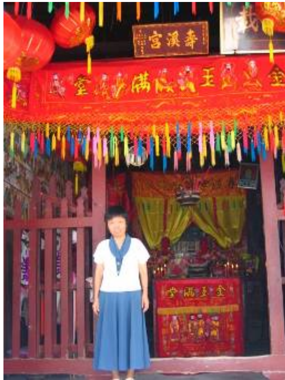
圖 3-19 南安下店村「壽溪宮」