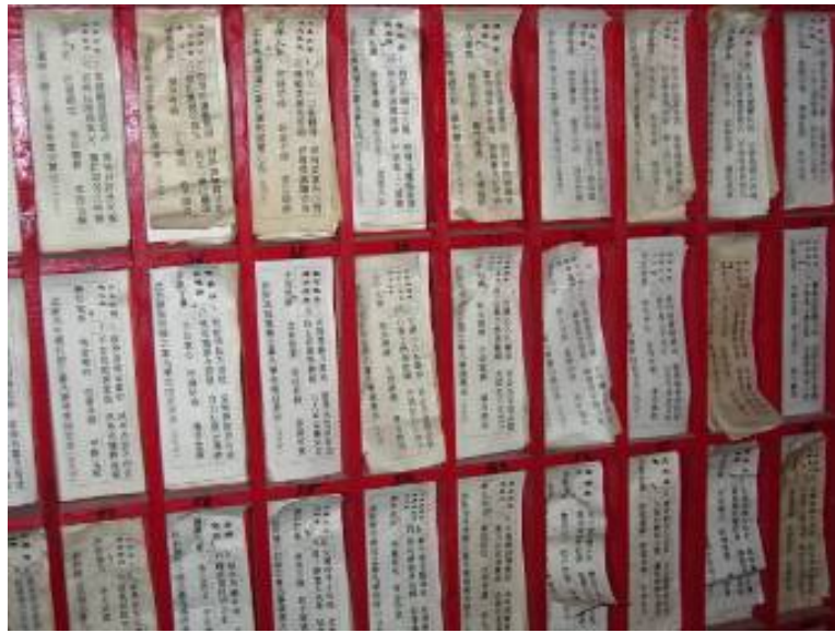
圖 3-20 壽溪宮壁上之籤詩