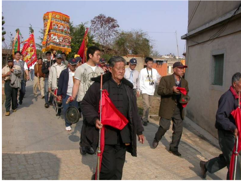
圖 3-2 五黃迎四安祖神像巡安活動