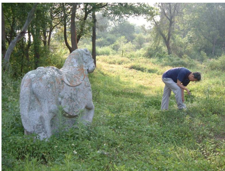
圖 3-15 熟悉掌故之黃獻鐘先生