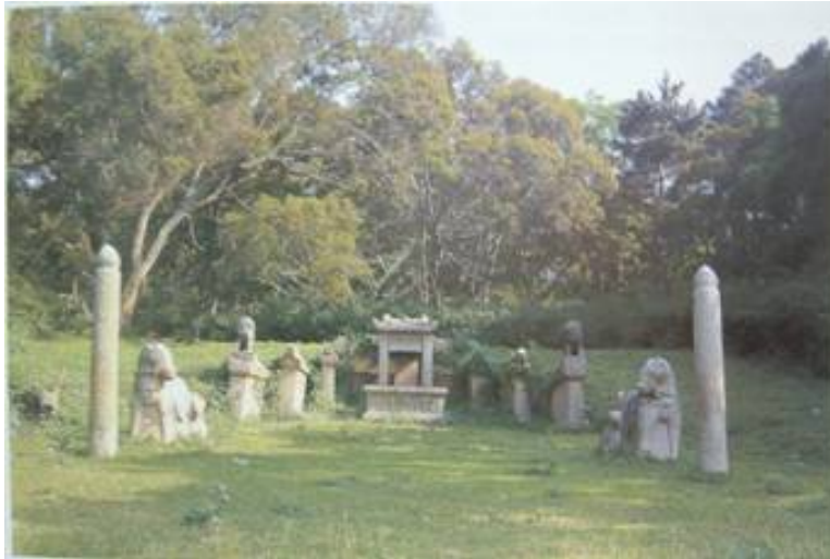
圖 3-5 浦邊黃龍山之「仙人覆掌穴」