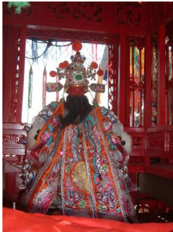
圖 3-17 黑髯之黃府大王爺