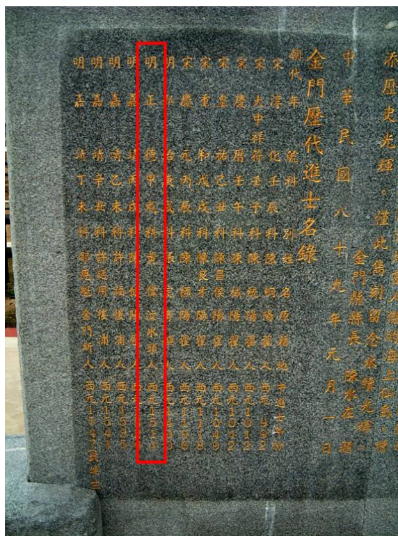
圖 3-4 進士牆、博士壁