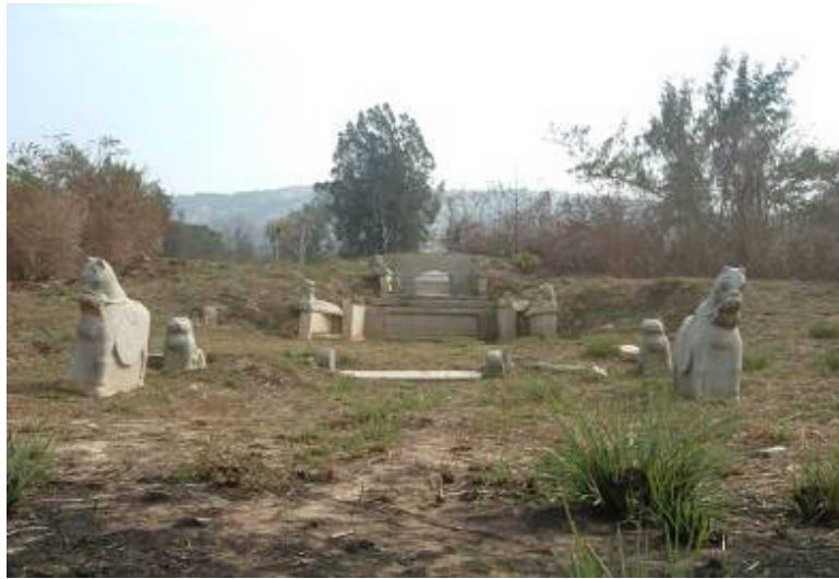
圖 3-10 黃偉「飛鴉落田」穴

黃偉逝於明嘉靖十七年（1538）三月十七日，同年五月二十七日安葬在後水頭村南一處高地上，由太武山一脈而下，形如鳥張翼狀，俗稱「飛鴉落田」（圖 3-10），前臨平疇，有金沙溪自右前繞過；背負太武，以福建海岸為朝山。墓之最後方是正身的護牆（與一般墓塚在最後方不同），塚有兩層，底層以整片石材雕成長方形，中間凸出，上再蓋以如覆斗狀的凸形石塊（圖 3-11），塚前端兩旁各有一堵板狀石欄浮雕。墓桌宛如塋前的低階，桌的正前有三堵石雕圖案，兩側伸出三層墓手，在全島的明墓中，此墓特色獨見。