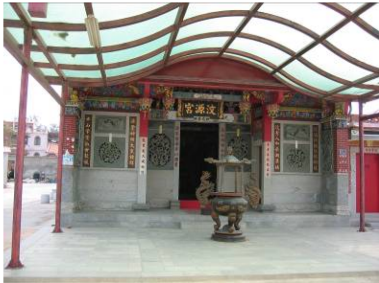
圖 3-18 配祀黃偉之「汶源宮」

位於後水頭村榮湖濱（圖 3-18），俗稱下宮，兩落。建於明代，主奉田都元帥（含大元帥、二元帥、三元帥），另奉恩主公、恩主娘（二者均在殿泥塑佛像）、池王爺、邱王爺、註生娘娘、福德正神、太守祖…等。