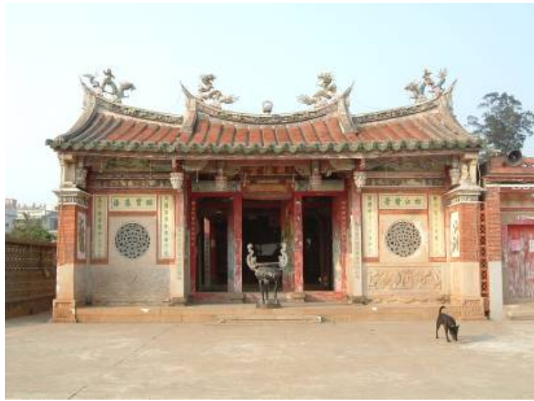
圖 3-16 主祀黃偉之慈德宮