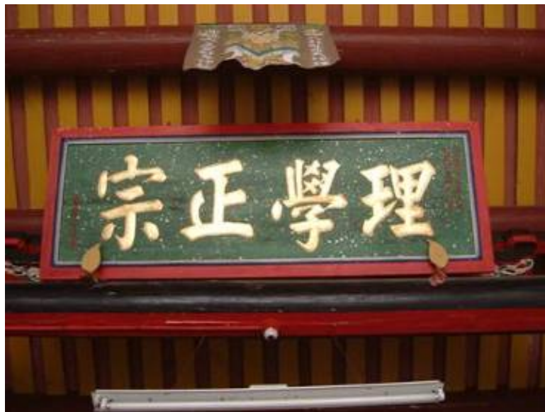
圖 3-9 理學正宗匾

另「理學正宗」匾則懸掛在後浦頭村黃氏家廟中（圖 3-9），該家廟最近重修落成，今後水頭和後浦頭黃氏以「理學正宗」為燈號，乃是推崇黃偉是朱子之後理學大師，學問精純之意。