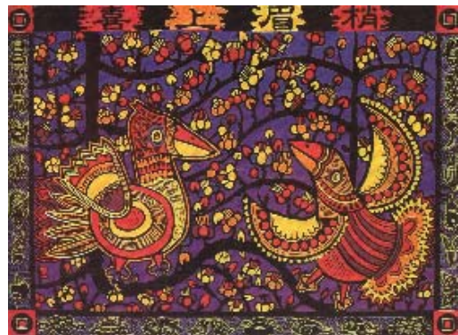
▲圖 2-1 羅和平【喜上眉梢】

在中國吉祥繪畫裡以壽石上配上菊花、蝴蝶與貓稱之為「壽居耄耋」，以四季花插在花瓶中意味「四季平安」；以牡丹與玉蘭合畫謂之「玉堂富貴」畫喜雀在樹梢，謂之「喜上眉梢」圖 2-1……。其他還有以植物、花果、鳥獸……諧音來象徵如，「馬上封侯」、「竹報平安」、「柿柿平安」、「三羊開泰」……，就是一種超越視覺增加繪畫趣味性的觀念。