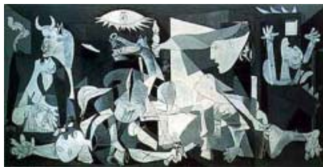
▲圖 2-4 畢卡索【格爾尼卡】 1937 年 畫布、油彩 351 x782 cm 馬德里·普拉多美術館藏

跳脫約定俗成的繪畫公式，是繪畫創作中感性的一面。但是到底有什麼方法可以幫忙我們增進視覺藝術的感性？首先我們必須學習如何去看見，看見不只是「看」( look ) 而已，它需要達到「見」( see ) 的程度。「看」只到藝術作品的形象層，「見」是已達到藝術作品的感知層。「見」是知識與智慧，是把「眼」和「心」連在一起在。美感經驗中，我們需要「見」到一個意象或形象，這種見就是直覺或創造；所見的意象須恰好傳出一種特殊的情趣，這種「傳」就是表現或象徵；「見」出意象恰好表現情趣，就是審美或欣賞。創造是表現情趣於意象，可以說是情趣意象化；欣賞是因意象而「見」情趣，可以說是意象的情趣化。美就是情趣意象化或意象情趣化時心中所覺到的「恰好」的快感 (註2-5) 。所以繪畫創作是要學習如何將知識與智慧融合在畫作中，使創作更具深層的意義。