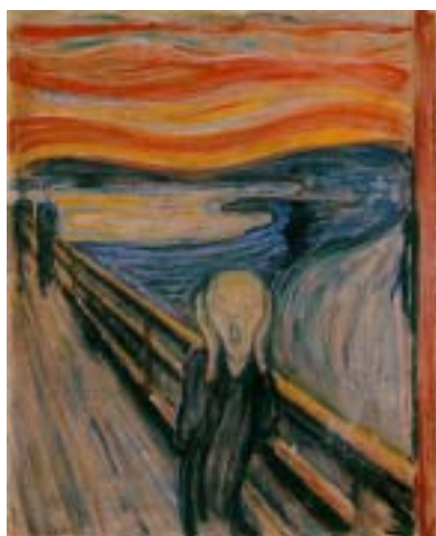
▲圖 2-3 孟克【吶喊】 1893 年 油畫 91 x73.5 cm 奧斯陸國立美術館藏