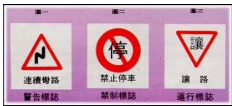
◀圖 2-2 「交通標誌」

符號既與實在對應，又超越實在對象之上，故是形而上。以一個形而上的符號形象去代替客觀世界的存在與運動作形而上的表現，此便是符號之表現意義。例：「v」代表勝利；「骷髏」意味死亡；「交通標誌」圖 2-2；聲音的運用；十字架作宗教之表現；以數理符號作科學之表現；以聲音色彩作藝術之表現等。