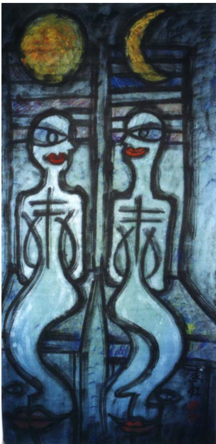
圖十、【沒事「坐」】 120 x60 cm 2002 年