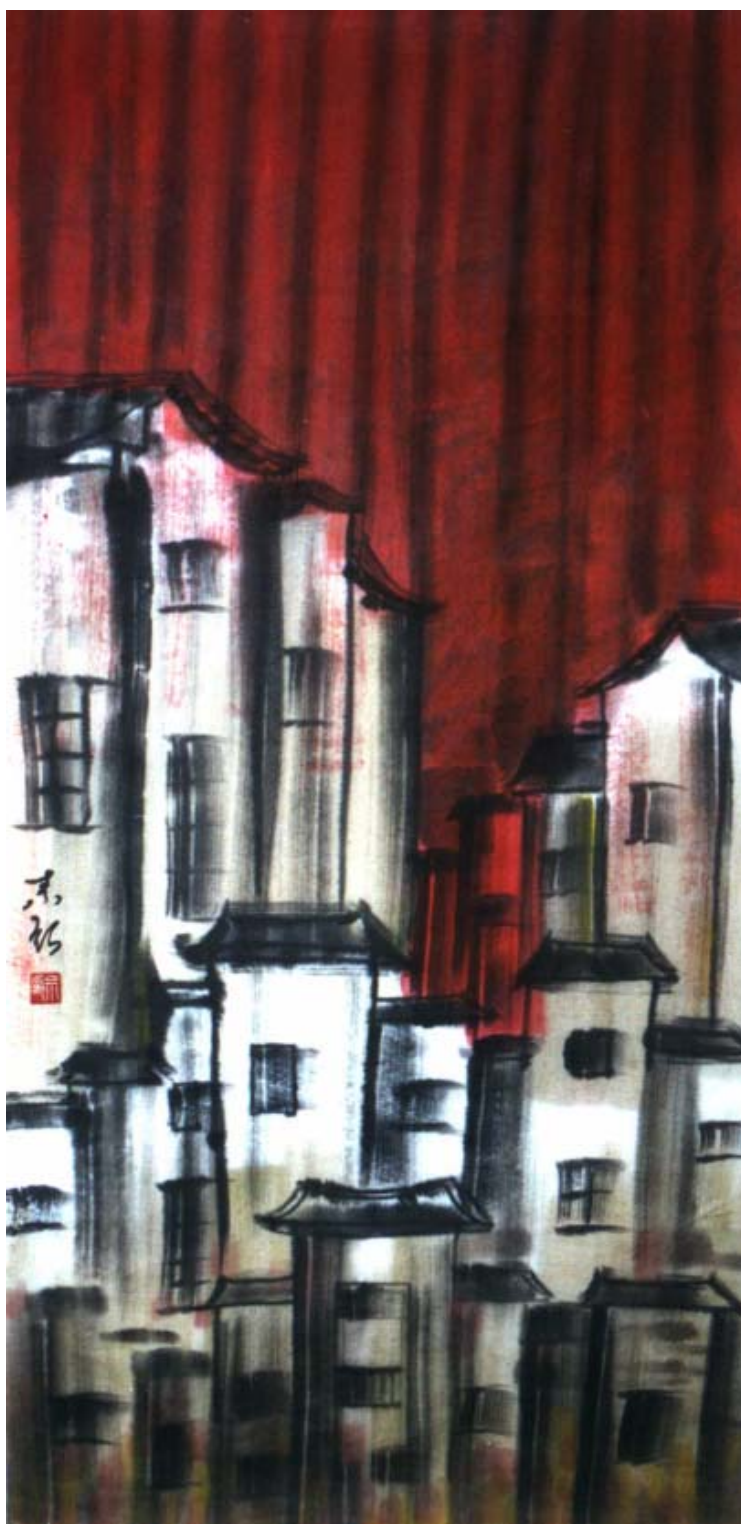
圖十四、【曾經繁華 II】 120 x60 cm 2002 年