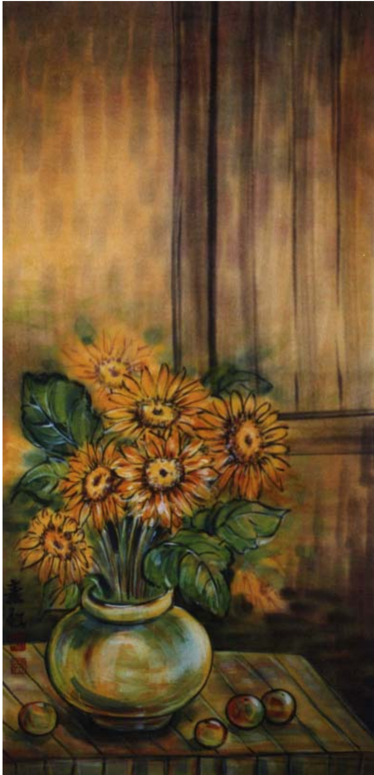
圖六、【屋內的向日葵】 120 x60 cm 2002 年