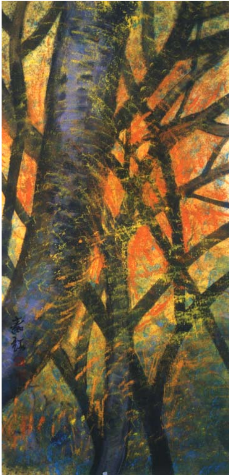
圖八、【低背景】 120 x60 cm 2002 年