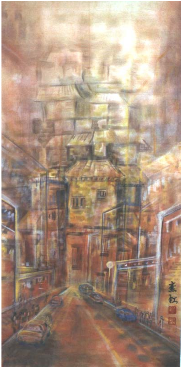
圖四、【歲月的記憶】 120 x60 cm 2002 年