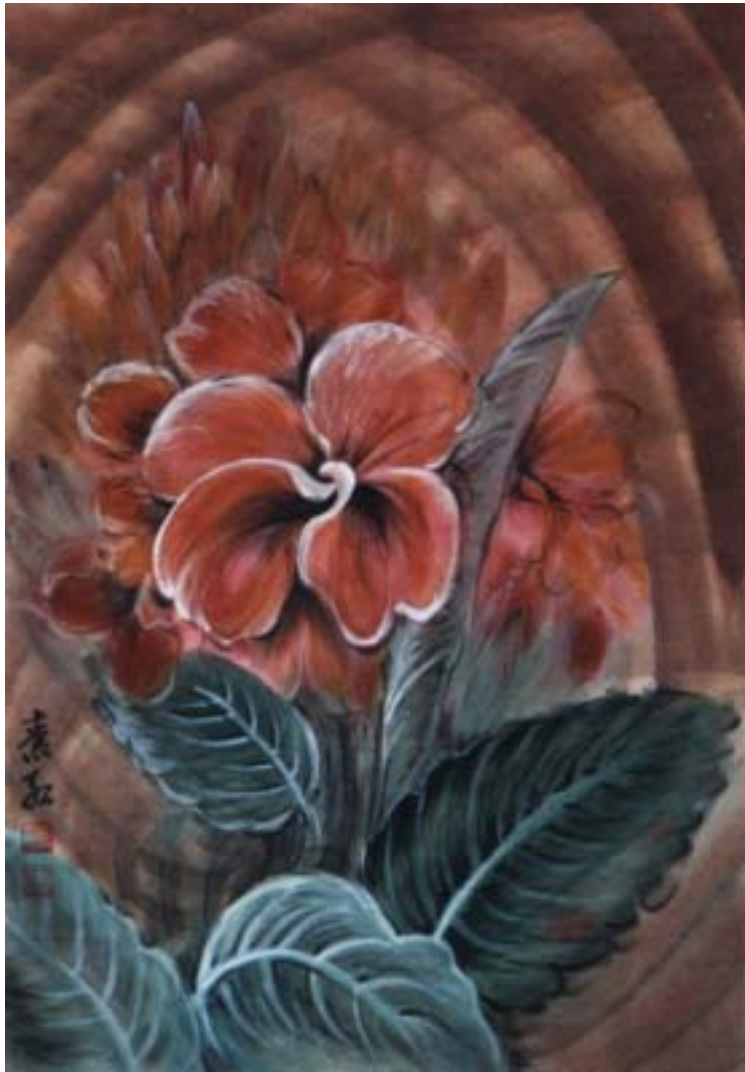
圖二、【短暫中的永恆】 95 x60 cm 2000 年