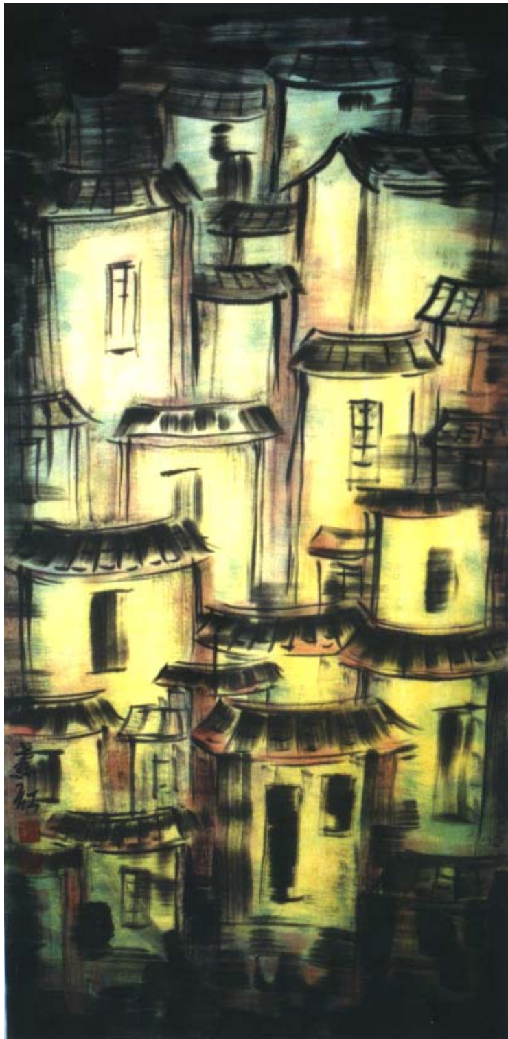
圖十三、【曾經繁華 I】 120 x60 cm 2002 年