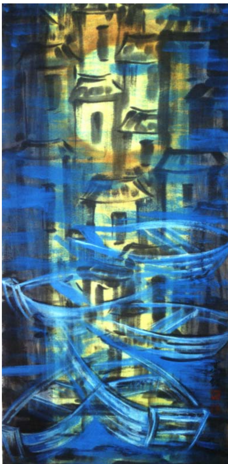
圖三、【交錯的記憶】 120 x60 cm 2002 年