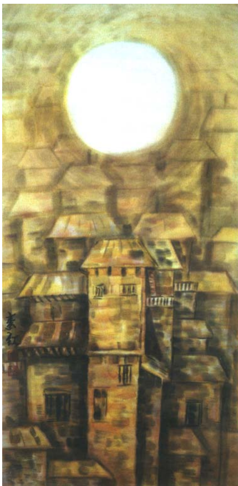
圖十五、【曾經繁華 III】 120 x60 cm 2002 年