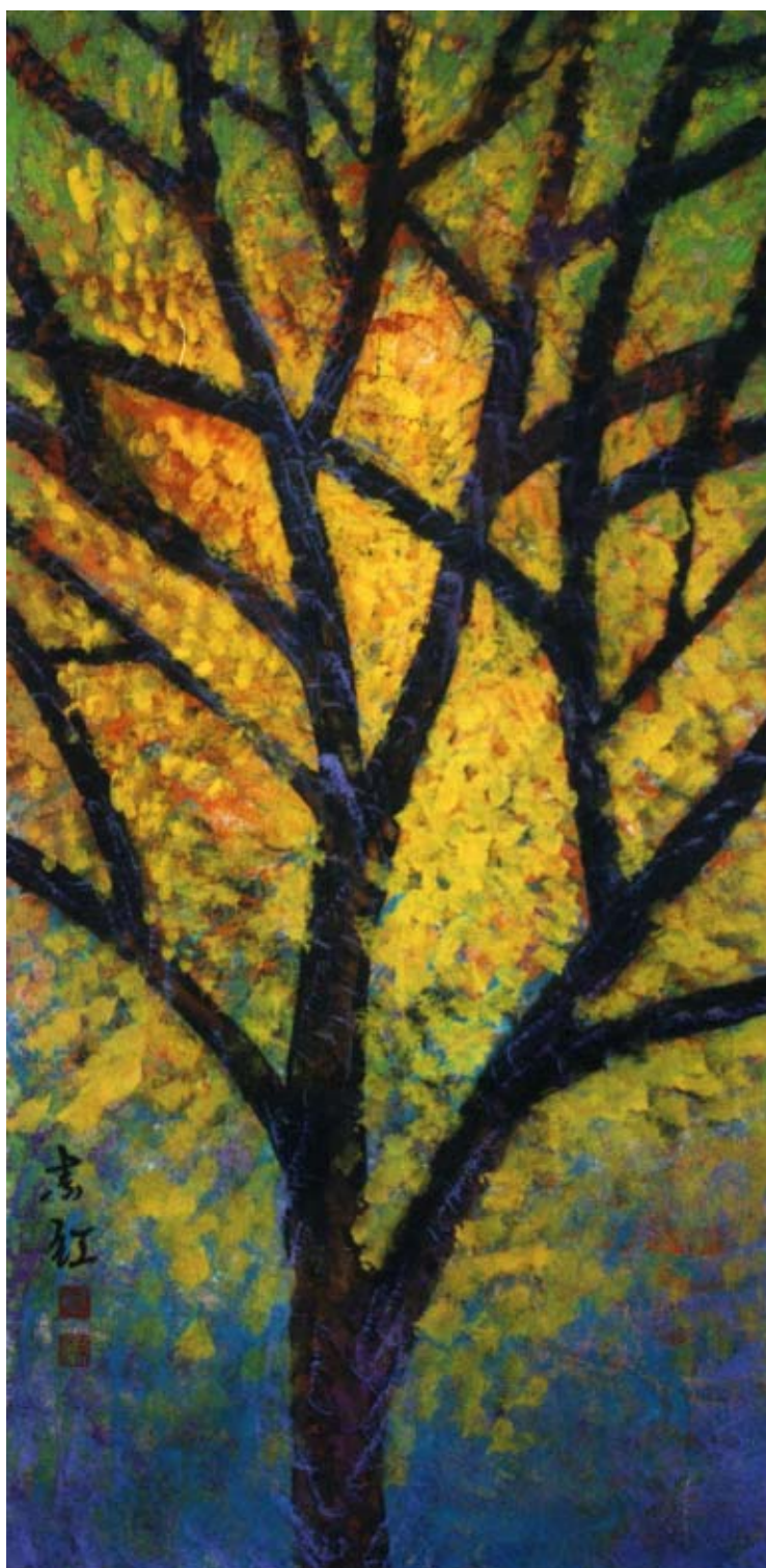
圖七、【高背景】 120 x60 cm 2002 年