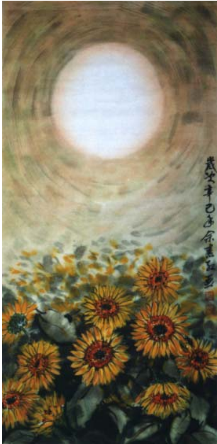
圖五、【艷陽下的向日葵】 120 x60 cm 2000 年