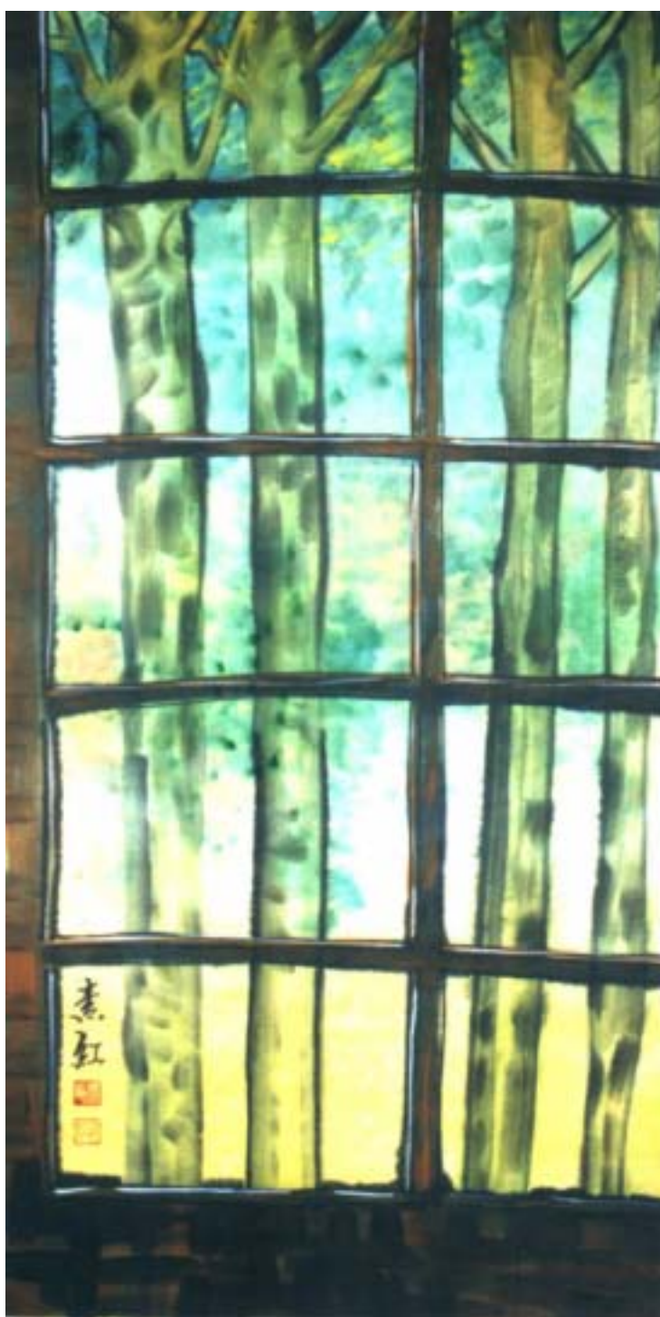
圖十二、【窗外】 120 x60 cm 2002 年