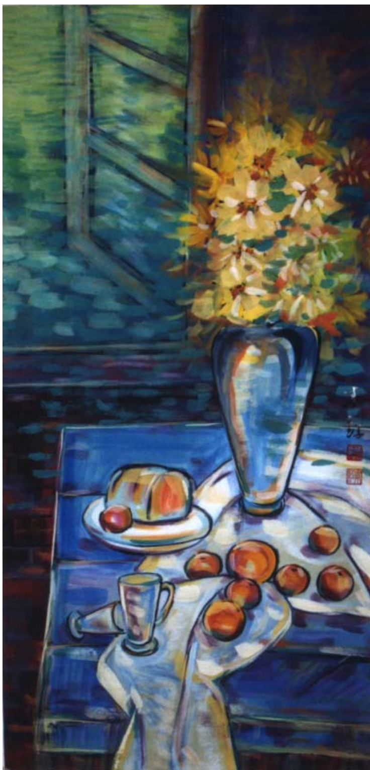
圖十一、【窗內】 120 x60 cm 2002 年