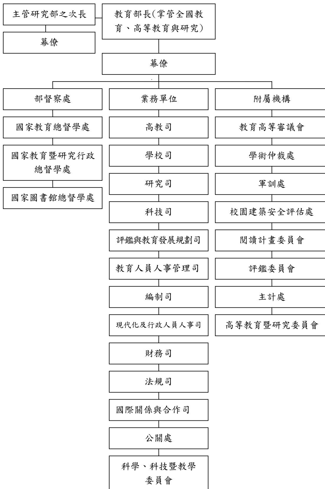
圖 3-2 法國國家教育暨高等教育與研究部組織圖