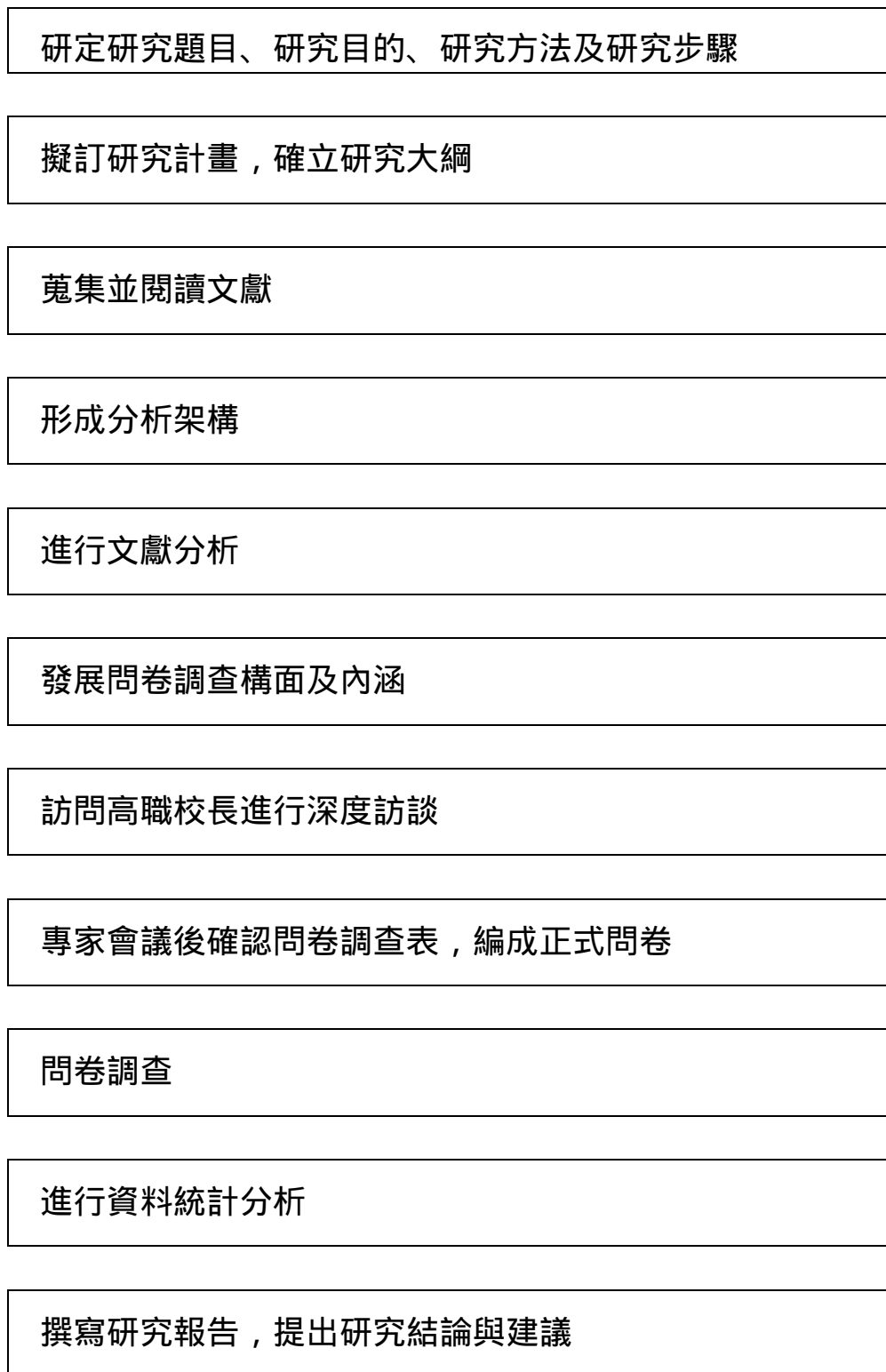
圖 3-2 研究步驟圖