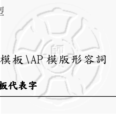
表格 16 嘗試動補語型