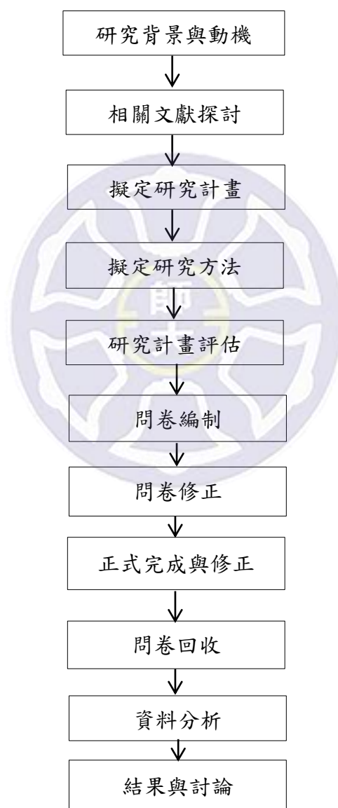
圖 3-2 研究流程圖

本研究之研究流程如圖 3-2，依照研究動機與目的，訂定研究主題，並整理相關文獻擬定研究目的及問題，並選定國內中小學圖書教師為研究對象，再根據研究目的、研究問題，選擇問卷調查作為研究方法，透過文獻探討進行問卷調查之研擬設計。並且回收有效問卷進行統計分析，結合問卷統計分析完成最後的分析結果，撰寫研究報告並提出研究發現與建議。