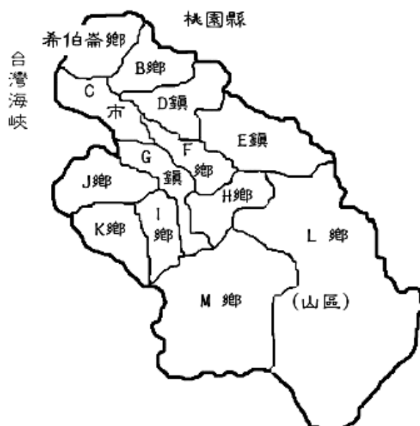
圖 2-1 新竹縣各鄉鎮分布圖

新竹縣共有一市三鎮九鄉，希伯崙鄉位處新竹縣最北端(圖 2-1)，在濱海邊陲地區的農漁村落，屬於資源不利的偏遠地區。從當地火車站到達設園預定地的《小和村》(化名)附近之研究場域，僅有唯一的交通工具，一天僅有六個客運班次，有些受訪家長的住處或幼兒園並非站牌所及之處，交通相當不便。希伯崙鄉因早期墾拓在沿海處而以閩南人為主，次為客籍人口。漁戶人口為新竹縣最高，畜牧業為各鄉鎮之冠，是農作物主要產地。居民主要以農兼捕魚為業，後因西距該鄉二公里的新竹工業區開發，工商日漸發展，勞工多以該鄉為居住地，鄉內也有百餘家製造業工廠，年青一代均改而從事工商業活動，但仍秉持傳統思想，守法勤儉且能刻苦耐勞。