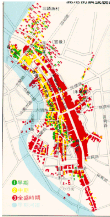
圖 2-20 鹿港街鎮發展

鹿港的古街鎮，由於它位於河口，沿河形成幾條平行的線形街道，街道的分布即呈現帶狀，仔細來看具有一些有趣的特質。主要的大街則在碼頭的後面，且分段形成了五個街廓，俗稱五福街 29 。鹿港自古並未築城來防禦，也沒有經過仔細規劃，而是自然形成，因此在空間上充滿變化，建築物必須配合交易買賣的功能，大都是店鋪住宅，整個街區呈現傳統商業形態的長條形聚落。另外，受到移民宗親、姓氏或同鄉的影響，鹿港很明顯的形成各個不同的「生活圈」。所以，因同行業、同姓氏或同利害關係等形成聚落，因而自設的隘門，極為特殊。下圖 2-19 鹿港街鎮發展由零星綠色、黃色到大面積紅色色塊的分佈情況，是陸續興起。