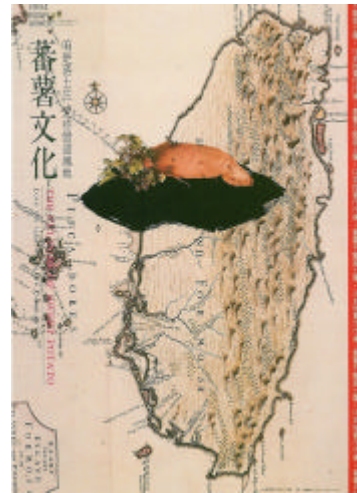
圖 2-2 蕃薯文化 柯鴻圖 1994

符號的意義主要是根據該符號與其他符號之間脈絡來決定，將符號意義組成關係分為系譜軸（paradigmatic）毗鄰軸（syntagmatic）兩種方式 22 。