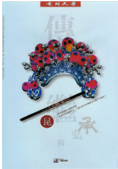
圖 2-8 蘇州崑曲 岳建良 2002