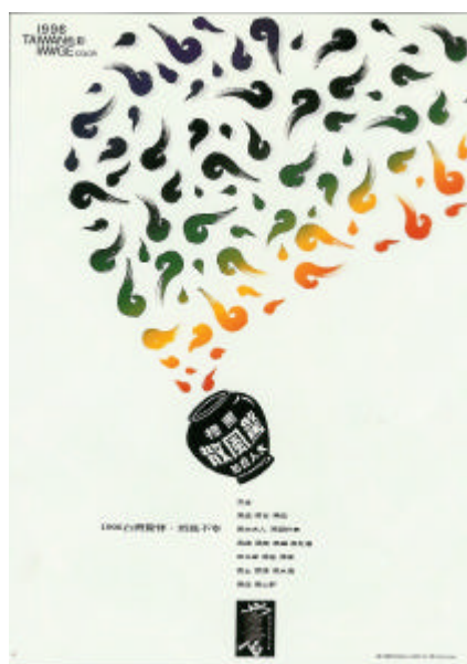
圖 2-16 台灣驚悸 - 黑 蔡進興 1996

代表台灣？這些有關畫面各種視覺符號運用問題，即是「語法學」的範疇；對於小孩子驚悸夜啼、吐乳青便，祖母會餵食“黑研標驚風散”的情景；台灣社會色彩紛亂，但使台灣驚悸、煩燥不寧的應該是那混濁的“黑”而“黑標大人驚風散”是否能為台灣鎮驚退熱，疏風順氣，盼您能三思。這些符號意義的傳達，更是屬於「語意學」的重要部份；而對“黑研標驚風散”及問號等視覺符號的選擇、符號來源的分析，則是「語用學」的問題。