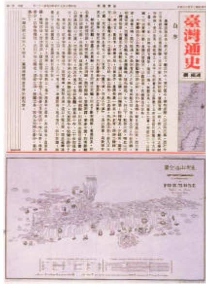
圖 2-7 台灣通史 林磐聳 1993