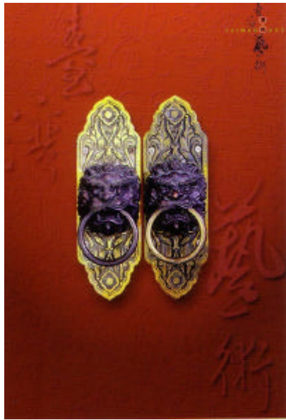
圖 2-17 台灣傳統藝術