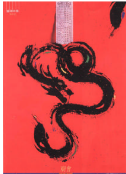
圖 2-11 廟會台灣 柯鴻圖 1996

相似，也沒有直接關係，而是社會中約定成俗的一種規則。以下四張系列作品，所表達的是東西方文化之對照，每個符號都能代表或象徵一種事態及該環境所產生之意識，如圖2-12~圖2-15(見25頁)。