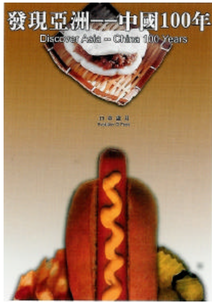
圖 2-12 口中歲月 仲居明 2002

圖2-15 以修飾手指之裝飾來說，西方象徵的是彩繪指甲，而東方則是套上裝飾華麗的指套。