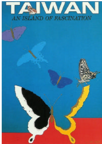
圖 2-10 蝴蝶王國 柯鴻圖 1996