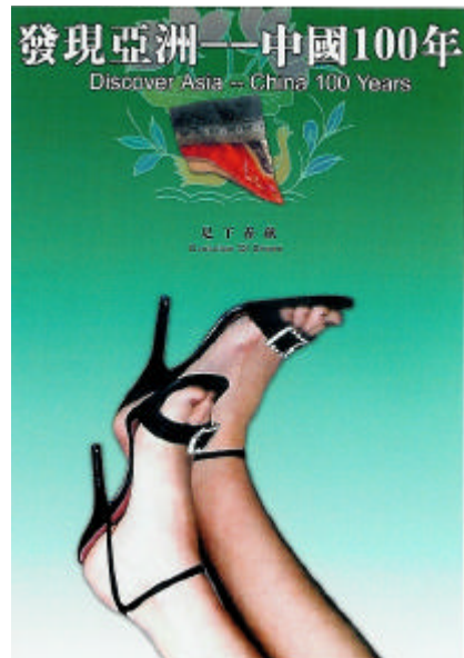
圖 2-13 足下春秋 仲居明 2002