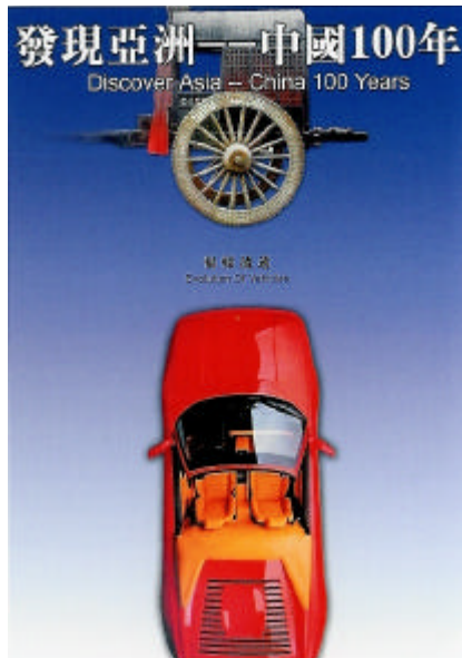
圖 2-14 輻輳流逝 仲居明 2002