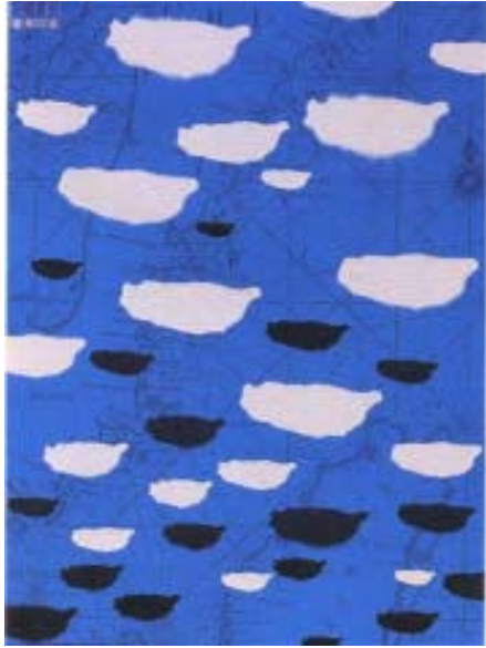
圖 2-6 台灣印象 林磐聳 1993