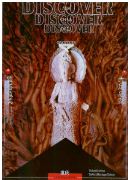
圖 2-4 發現 揚仁敏 2002

圖2-6 島形傳遞無形的思想，背景是西方國家對台灣測繪及航海的地圖，代表台灣上、地球上的座標。