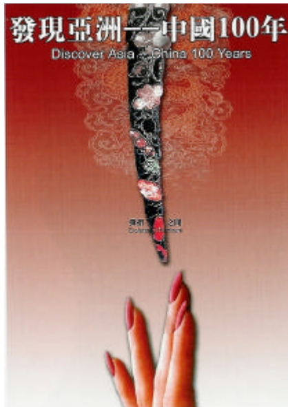
圖 2-15 彈指之間 仲居明 2002