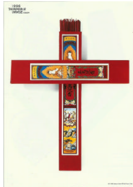
圖 2-18 台灣人心誠則靈 何清輝 1996