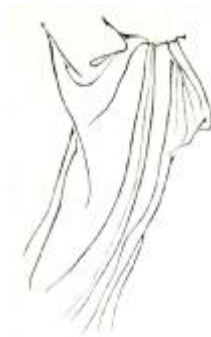
範例來源：《水墨畫法·人物·器物》頁 49

因起筆的部分讓人想起如打進的釘頭，收筆的部分又好像老鼠尾巴般細長的線而得名。是吳道玄創始的畫法，又稱「吳裝描」，因線條強而有力，故適用於畫面較大的圖。人物適合表現於硬的絹織品，但所畫的描線一形成飛白，絲綢就令人有些陳舊的感覺。 4