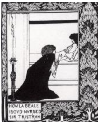
《亞瑟之死》(1893) 插圖