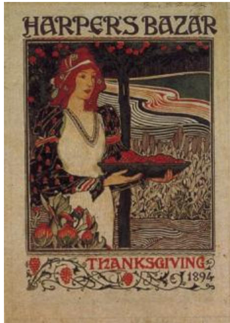
《哈潑時尚》(1894) 雜誌封面