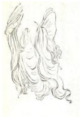
範例來源：《水墨畫法·人物·器物》頁 47

這種畫法是用仿若雲掠過溪谷、水流過般似的描線而得名，是元朝王公麟創始，全部用素描畫的。因為是中鋒，且混合深淺墨色加以線描，故運筆須相當熟練，專門用於表現高貴人士細緻的布質或僧人的衣紋等。 3