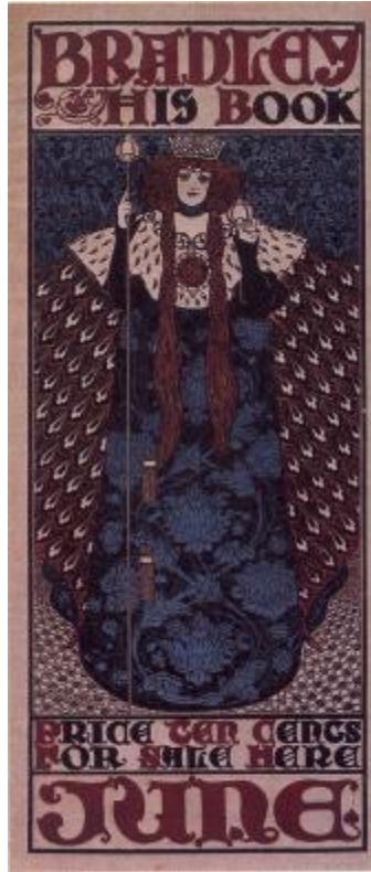
《布萊迪：自己的書》(1898) 封面

布萊迪強調曲線和黑白對比的效果，字體和排版的風格一致，順暢自然，具有很高的藝術性。他的特色是富於裝飾性的線條和豐富的想像力，插圖和文字分別用長方形的框架圍繞起來，具有明確的功能區域，毫不混淆。對於十五、六世紀歐洲的出版風格非常著迷，特別是舊版字體、拙氣的木刻插畫、簡單而粗壯的版面編排方式等，常被他運用在作品中。 9