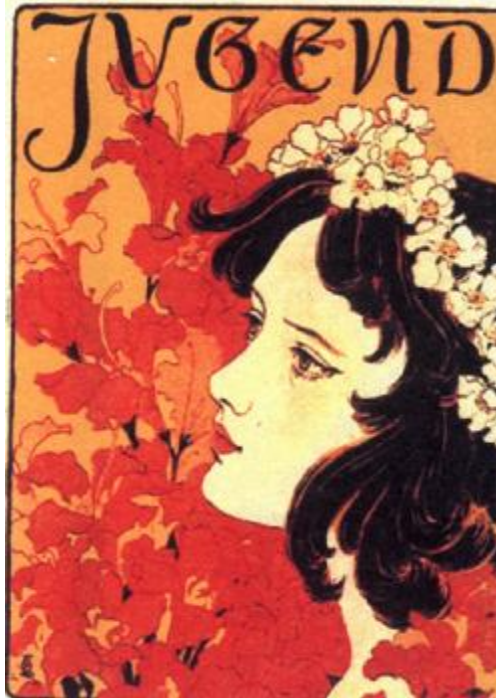
《查拉圖斯特拉如是說》(1908) 內頁