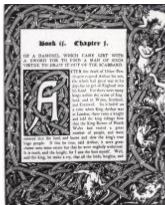
《亞瑟之死》(1893) 插圖

比亞茲萊的插畫充滿對性心理的描寫，他的插畫風格律動、自由、淋漓盡致，強烈的黑白對比與明快的版面設計，具有非常高的藝術價值。大量採用捲尾草花紋，複雜的黑白曲線纏繞，在捲尾草中有許多裸體女子與圖案糾纏不清，多是高度裝飾性的線條。 7