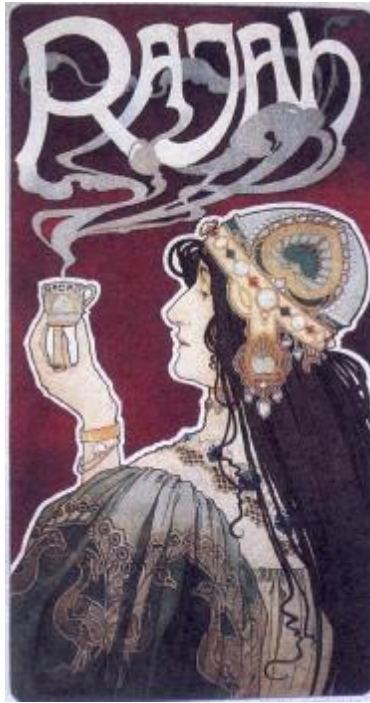
《查拉圖斯特拉如是說》