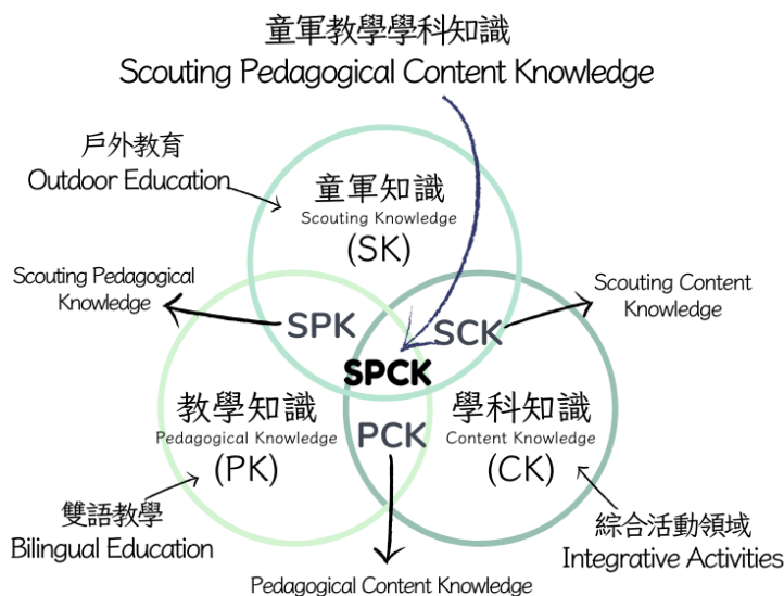
圖4 童軍教學學科知識架構

為求貼近教學現場，拉近師資生與國中課堂的距離，研究者在童軍教材教法中安排 2 場入班觀課、在童軍教學實習（一）課程中安排 4 場觀課，目的除了進入現場體驗課室中的教學實況之外，也能練習使用多種取向的觀課紀錄表。