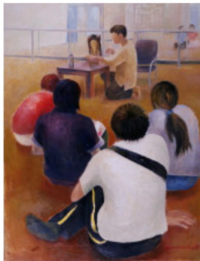
【圖 1-1】陳昱螢《技藝傳承 I》50F

鏡上，看到了更多學員正面的表情與肢體反應、教室空間的擺設或看不到的另一角落之教室空間與事物【圖 1-1】、【圖 1-2】、【圖 1-3】。在虛實的空間裡，可發現更多元的真實面相，有助於對象物的觀察與瞭解，也開啓了筆者對生活裡鏡射影像題材的關心。