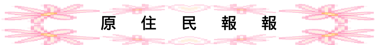
圖二 學習單一 原住民報報