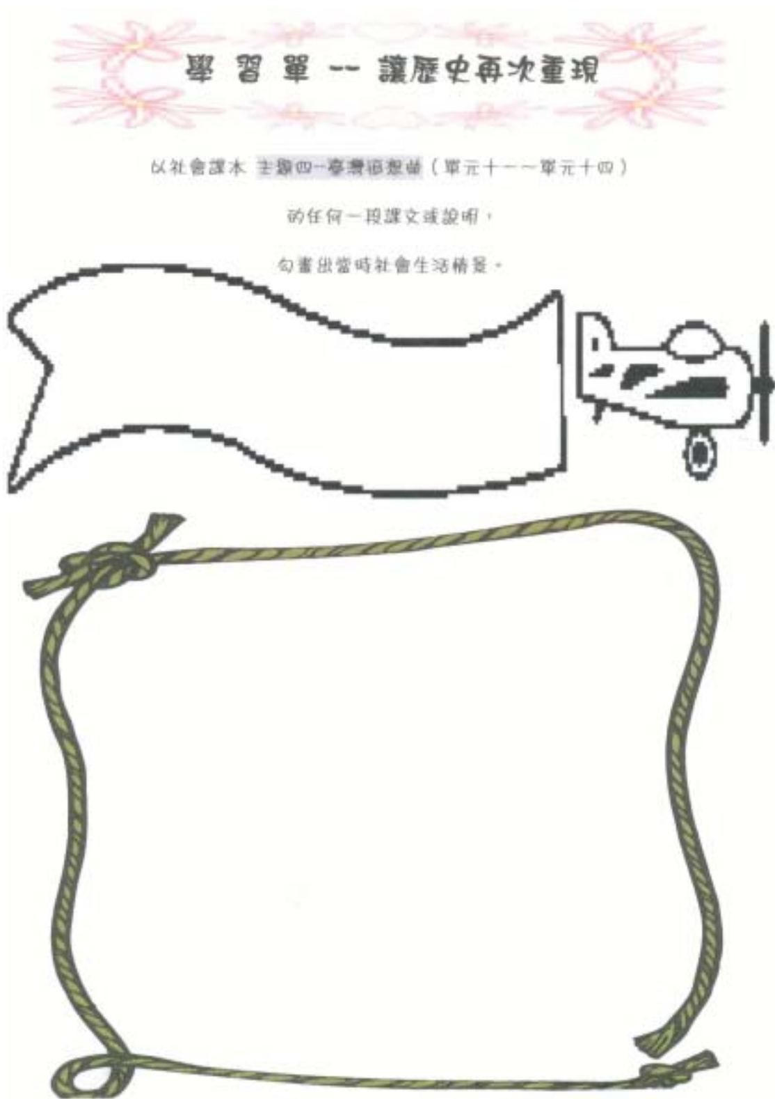
圖五 學習單五 讓歷史再次重現