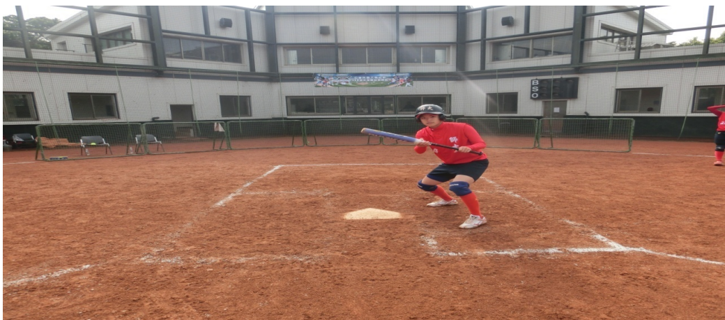
圖 1-1 預備動作

虛觸實擊是大家所稱的「收打」，目的就是為了誘使防守方採用趨前防守的攻擊戰術和促進打擊表現。其打擊方法可分為三部分，（一）預備動作：打者將球棒斜擺在本壘板上方做觸擊姿勢，其重心比正常打擊時還低且保持平衡（如圖 1-1）。（二）收棒動作：收棒動作需配合投手的動作（例如：投手繞臂至最上端），收棒的過程重心要保持穩定，球棒回復的位置是往斜後方移動，還未到達正常打擊的預備位置（如圖 1-2）。（三）擊球動作：迅速做揮棒擊球動作，擊球時手腕強調上手加壓力量至球點上，揮棒的擊球角度由上而下至水平的順暢動作（如圖 1-3）。