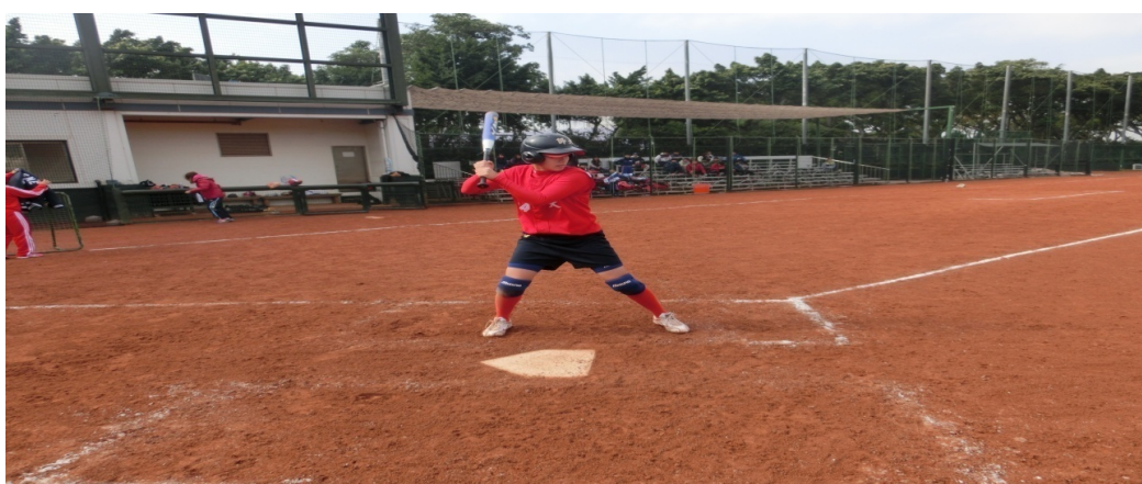
圖 1-2 收棒動作