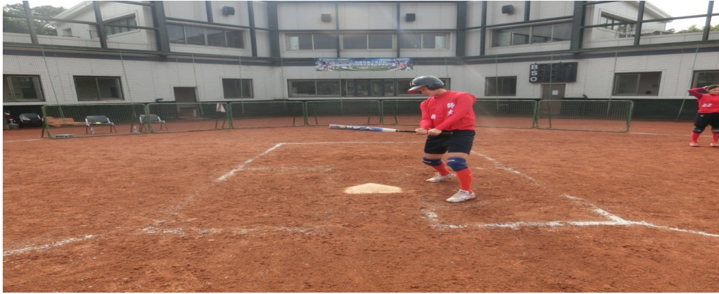
圖 1-3 擊球動作