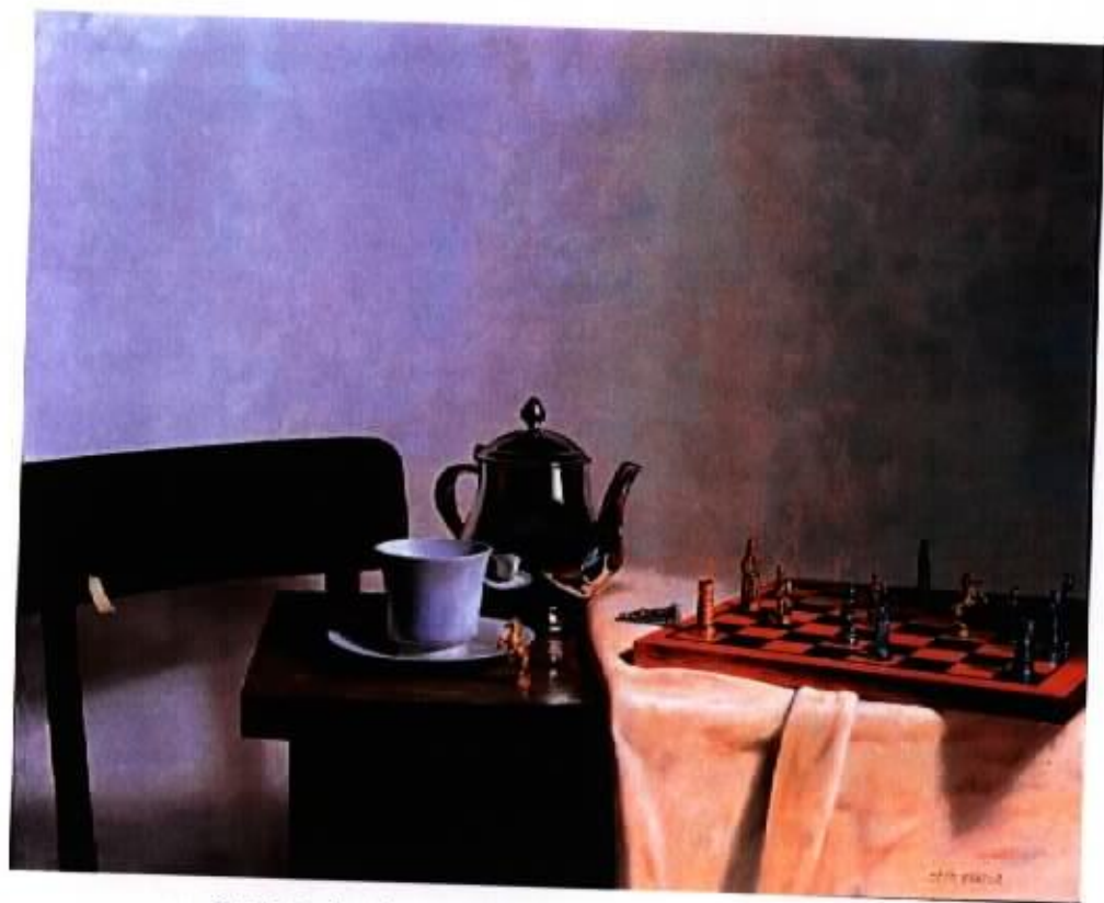
作品 13 『下午茶時刻』 15F 油彩，畫布 2003