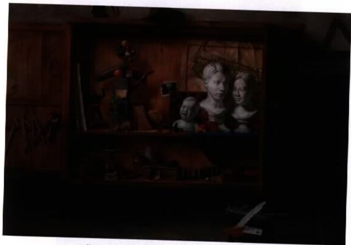
作品7『我的珍藏』 50F 油彩，畫布 2006

主體的描寫性和對比程度都高於其他物體，框架在此起了安定的作用，在紛亂的構圖中找到了秩序，也表現出異於其它構圖的視覺效果。