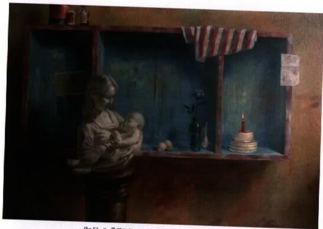
作品 9 『聖光』 50F 油彩·畫布 2006

主體雖是母女雕像，點燃主題的卻是燭光，這種遙相呼應的做法，令作品產生一道視覺軌跡。