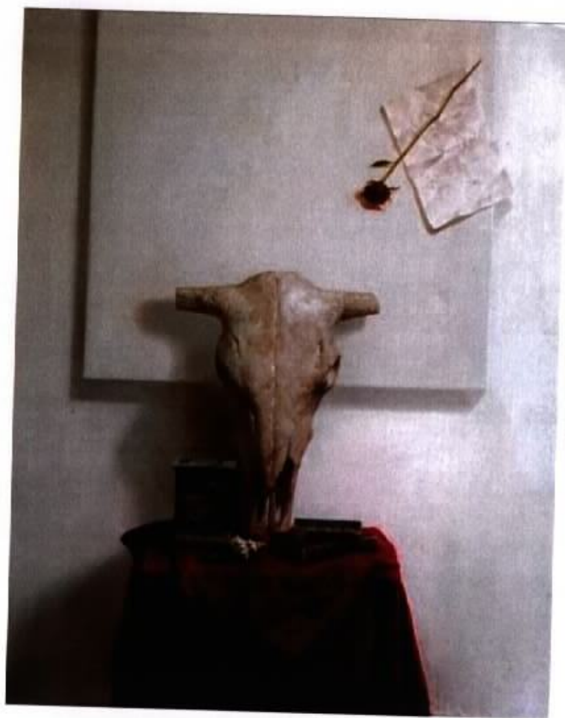
作品 12 『牛骨靜物』 30F 油彩，畫布 2003

祭壇式構圖嚴謹，桌面為一艷紅色桌布，有激情的特質，構圖與色彩的對立令主體具備豐富的思考性。