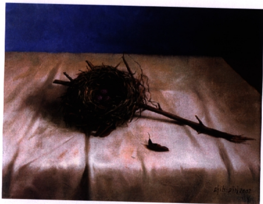
作品 14『歸宿』 6F 油彩·畫布 2004

創作的過程中，想像是不可或缺的因素，因為題材本身並不具備我們再現時的意義。以藍色背景襯托沒有成鳥的鳥巢，象徵家庭的殘缺。