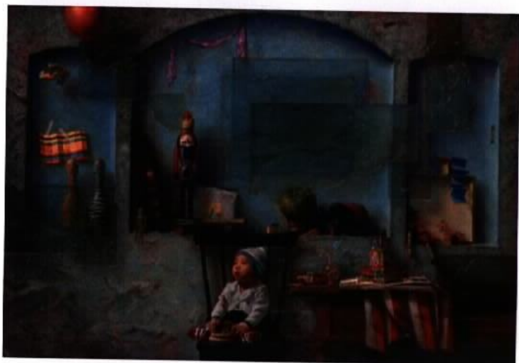
作品1『心樂園』 100P 油彩·畫布 2005

繪畫上的寫實覺對無法逼近事實，藝術作品也很少只表現一個受到限定的意義。我讓畫作具有不明確性，產生象徵的性格，捕捉超越生命的真實及理想的價值。