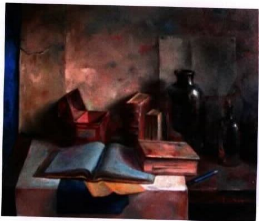
作品 15 『古意』 8F 油彩·畫布 2004

靜物的魅力對我而言就是為我所思，為我所用，不論造形與色彩，單純與複雜，都能體現我對描繪的用意。