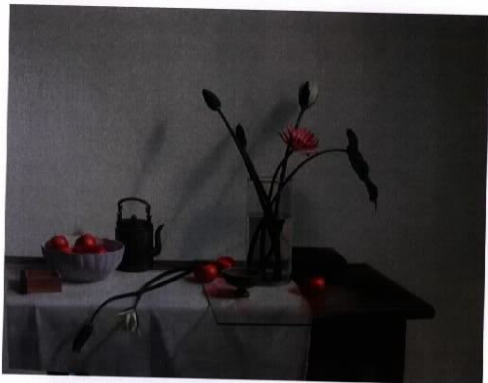
作品 11 『午后』 30F 油彩·畫布 2003

畫面的意義並不在作品本身，作品的單純性格會令作品與觀者產生聯繫，由觀者一方製造理念。