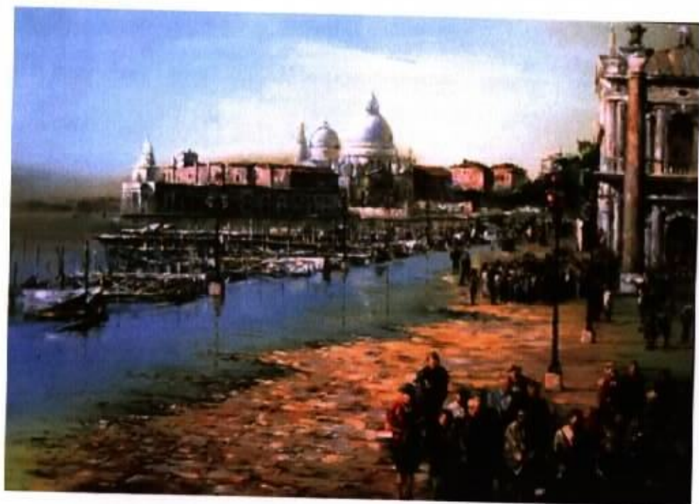
作品 16 『威尼斯之晨』 30F 油彩，畫布 2003

威尼斯的景致令人心曠神怡，我用較活潑的方式詮釋這件作品，沉浸在單純繪畫性的表現之中。