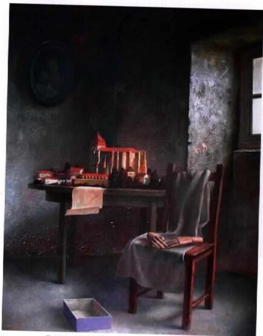
作品 5 『守護者』 80F 油彩·畫布 2004

藉一雙木手模型象徵自己當了父親後應該承擔的責任，此作採用較多水平線及垂直線重疊構成，在有限的空間中營造深度。