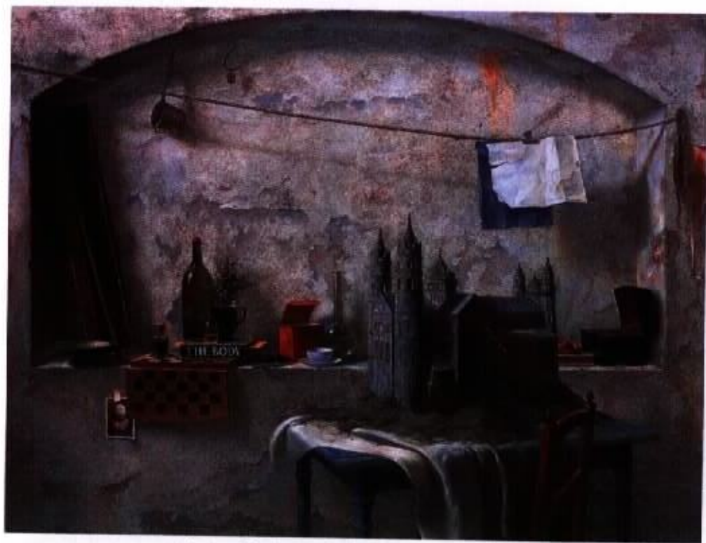
作品 2『淨土』 80P 油彩，畫布 2004

人人心中皆有一片淨土，只是在追求慾望之中，被遺忘了。心靈的充實是物慾無可取代的，只有再度尋找心中的這片淨土，生命方能獲的實質的滿足。