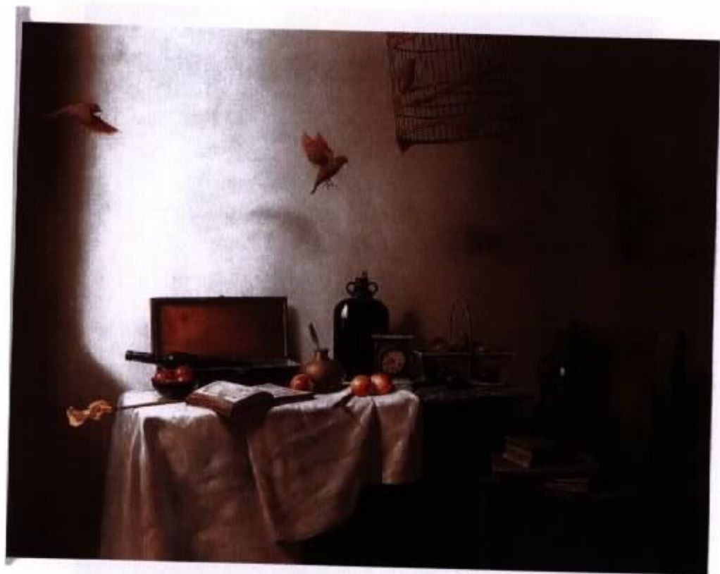
作品 4 『動靜之間』 80F 油彩·畫布 2003

動與靜是本件作品最強烈的對比，延伸出追求平凡中的不平凡之處，才能激起生命的漣漪。