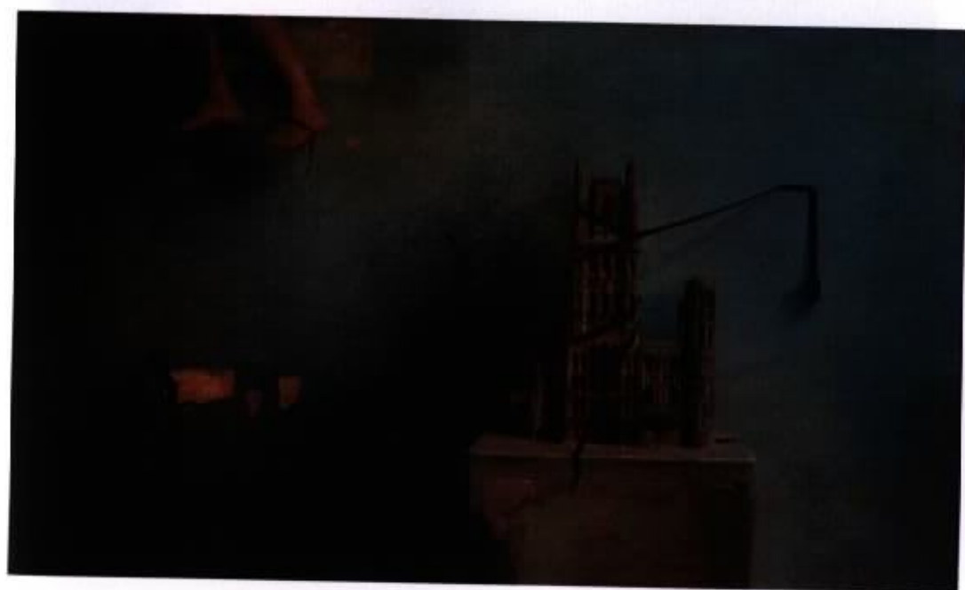
作品3『路』 100M 油彩，畫布 2006

意義無法與自身一致，只有藉由區分或連結，符號才能獲得意義。而符號正是意識形態的物質媒介，若無符號就沒有所謂的價值或觀念。這件作品由乍看不相干的教堂、足部、防毒面具構成，因為相對立而獲得自主性，建構當下社會人們的情境思維。