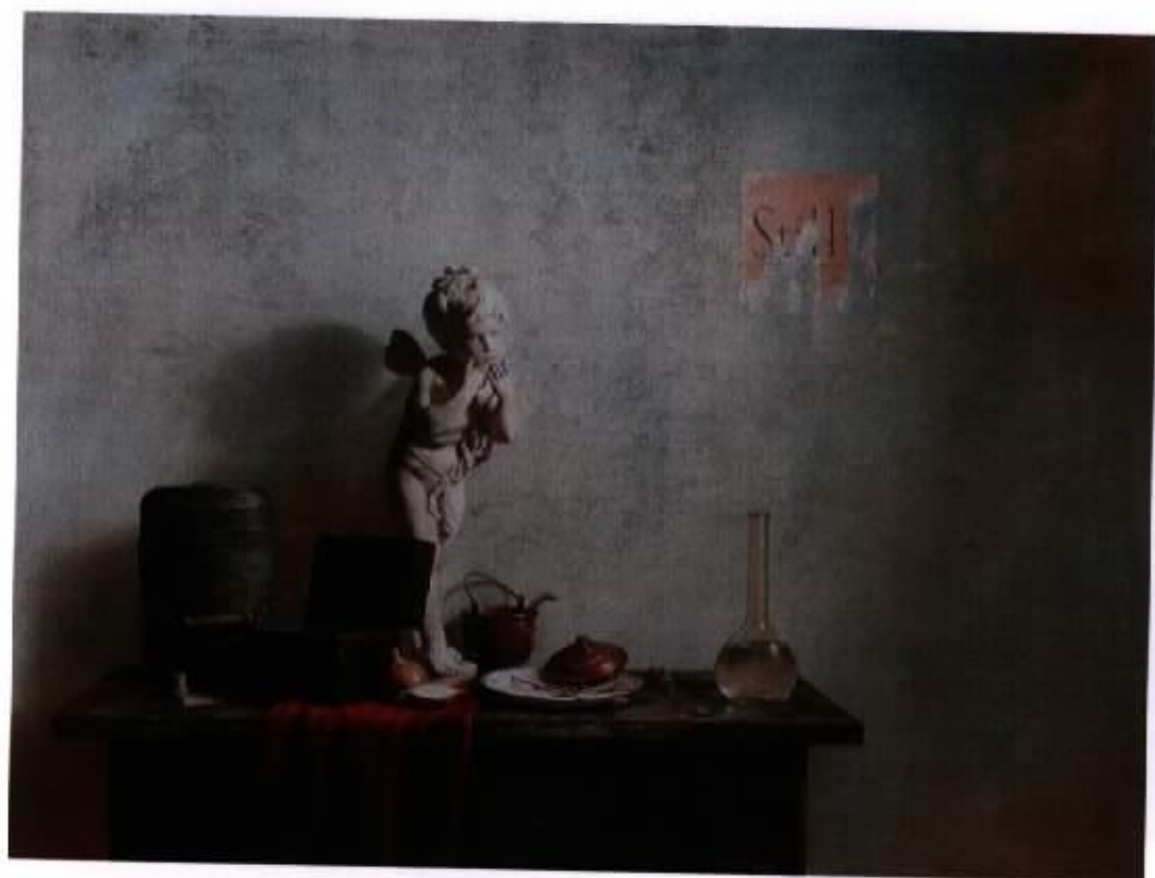
作品 6 『靜寞圖像』 50F 油彩，畫布 2003

畫面重心是明顯偏左的，令右邊的空間騰了出來，突顯牆上的紙張，強化文字的能見度，是屬心理層面的平衡構圖。