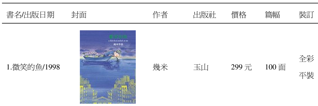
表 2 成人圖畫書抽樣調查書目

圖畫書是本世紀發展最迅速變化最快的文體(洪文瓊，2005)，它的多變與廣大的彈性，讓成人圖畫書市場顯得多元並且缺乏一制性。本研究所收集圖畫書樣本資料如下表 2 所示：