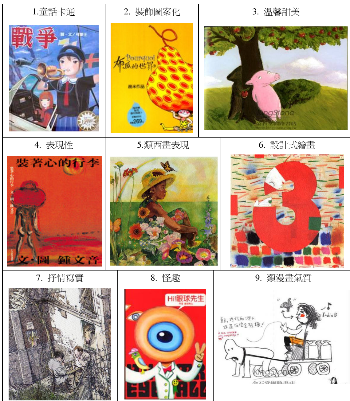
表 3 問卷圖片樣本圖表

圖片出處分別依序為：1.戰爭（可樂王，2003），2.布瓜的世界（幾米，2002），3.愛與快樂（凱雅瑞德/著，裘塔布克/繪，2005），4.裝著心的行李（鍾文音，2000），