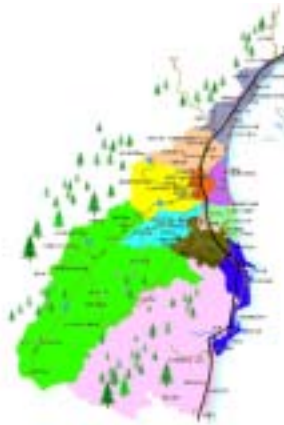
圖 4-4 宜蘭縣各鄉鎮 ( http://www.ilfa.org.tw/b/b-1-2.htm )