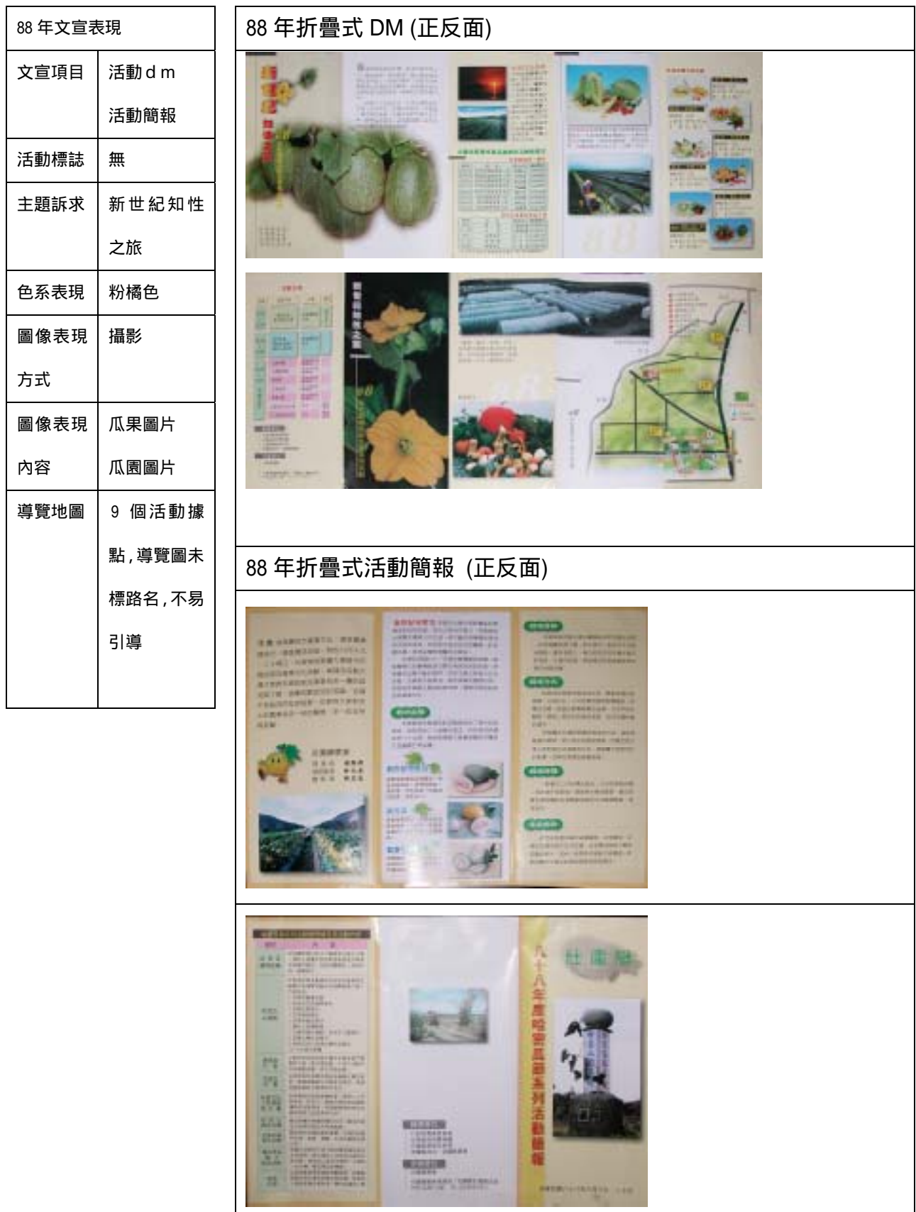
表 4-3 歷年活動文宣