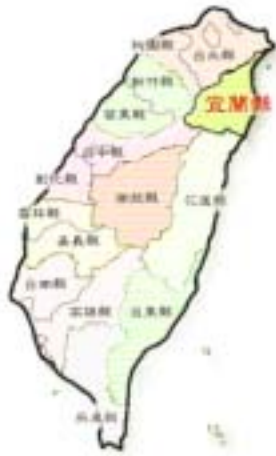
圖 4-2 宜蘭縣的地理位置 壯圍鄉隸屬台灣東北角的 宜蘭縣