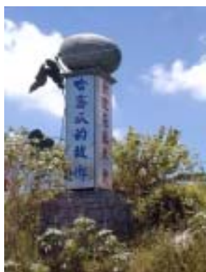
圖 4-7 壯圍鄉的目前精神指標（壯圍鄉農會）

在台灣由於人口稠密以及工業的過度開發，綠地山野逐漸被水泥叢林淹沒、空氣和流水慢慢地變質，然而宜蘭縣長期在交通不便以及氣候多濕的情形之下算是得以倖免於難。這塊土地東臨太平洋西面雪山山脈，長年受到雨水的滋潤，孕育出許多河川與湖泊，也沖積出土壤肥沃的蘭陽平原，除了造就了豐饒的農漁業經營環境，加上鄰近台北都會區的優勢，也成了發展休閒旅遊的最佳資源。