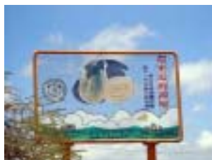
圖 4-6 歷年壯圍鄉的活動看板（壯圍鄉農會）