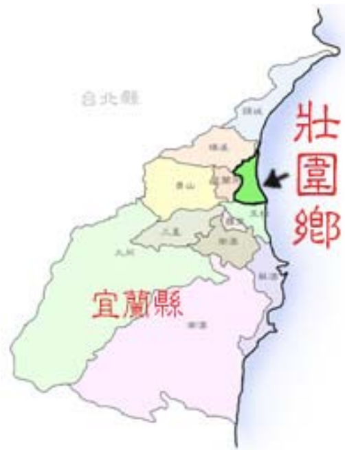
圖 4-3 壯圍鄉的地理位置