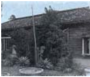
圖 4-1 早期的壯圍鄉公所 http://www.gtes.ilc.edu.tw/st_rongname/