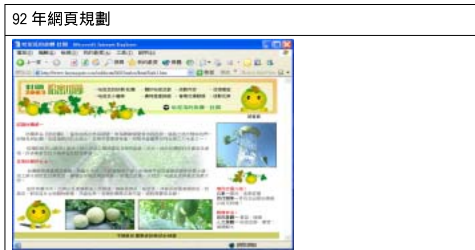
表 4-4 哈密瓜節歷年(88,90,91,92)文宣表現比較