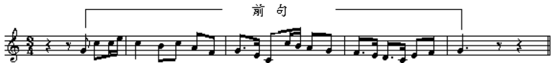
【譜例 6-11】第四樂章 第一主題

第四樂章主題為二段式歌謠體，由第一部豎笛演奏，由第 1 小節弱起拍動機及第 3、4 小節的附點音型組成。