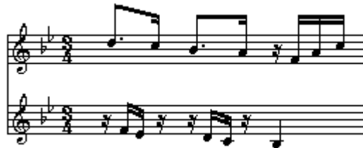
【譜例 6-12】第四樂章 對唱節奏