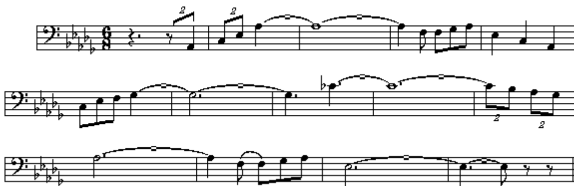
【譜例 6-4】第一樂章 第二主題 動機節奏

第四樂段由第一主題的尾句做句末擴充的增值（Augmentation）反覆後結束。