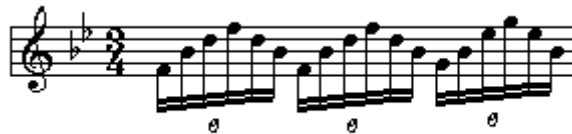
【譜例 6-13】第四樂章 六連音動機

第三樂段（第 25 33 小節）以卡農的形式，由雙簧管與高音薩克斯風演奏完整的第一主題，形成一種主題密接（Stretto）的作曲手法。