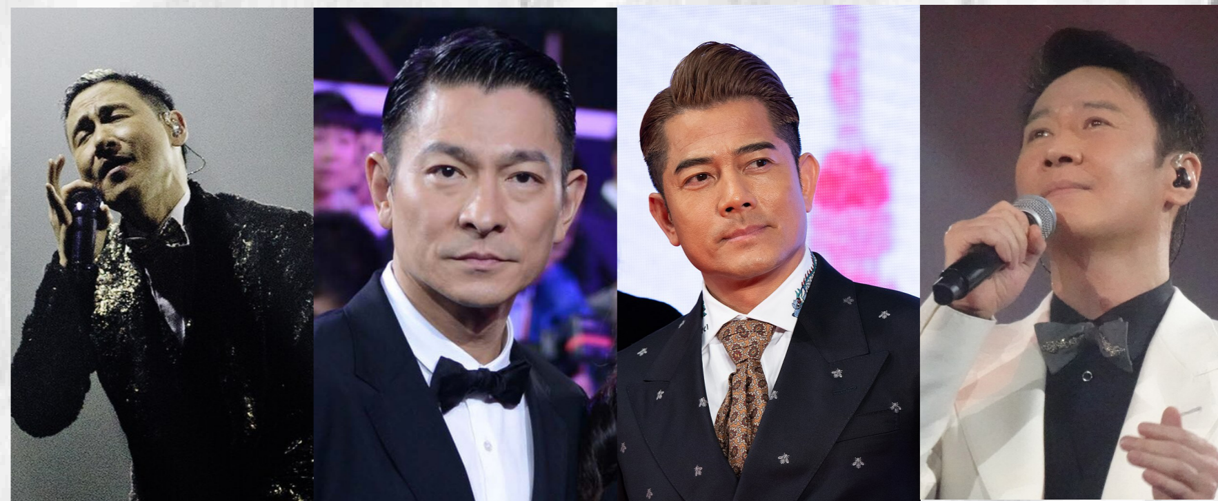
張學友(圖1) 劉德華(圖2) 郭富城(圖3) 黎明(圖4)