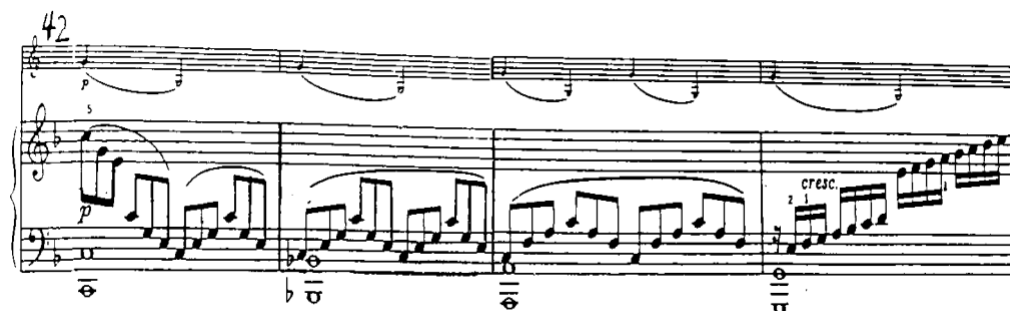
下表 4-7 分析 B 段中的主要旋律動向：