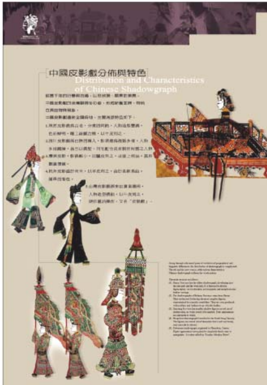
圖4.27 壁面展板(中國皮影戲分佈與特色)

展板製作特色為底板部份以3t鋁板為底材，表面施以不規則的磨砂處理，壁面腳架則以卯釘固定，並刻意露出卯釘頭，呈現出一種不同的粗獷美感。