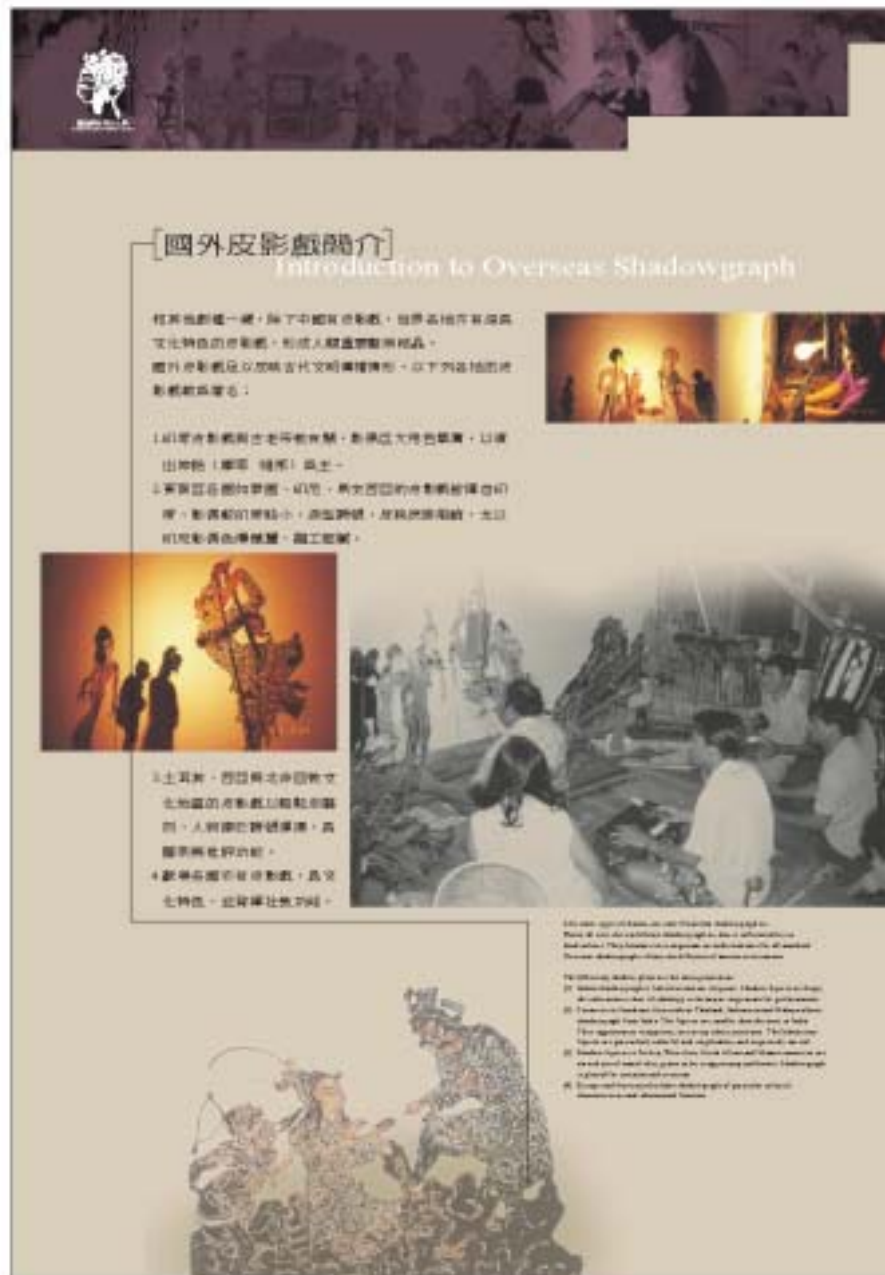
圖4.28 壁面展板(國外皮影戲簡介)

製作特色為底板部份以3t鋁板為底材，表面施以不規則的磨砂處理，壁面腳架則以卯釘固定，並刻意露出卯釘頭，呈現出一種不同的相槓美感。