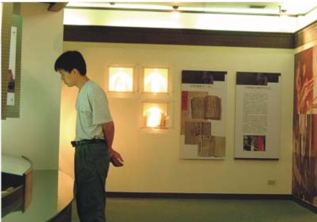
圖4.24 更新後壁面展板(皮影戲的傳承與未來)