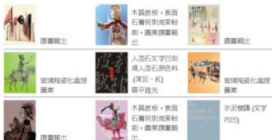
圖4.19 壁面裝飾施工法