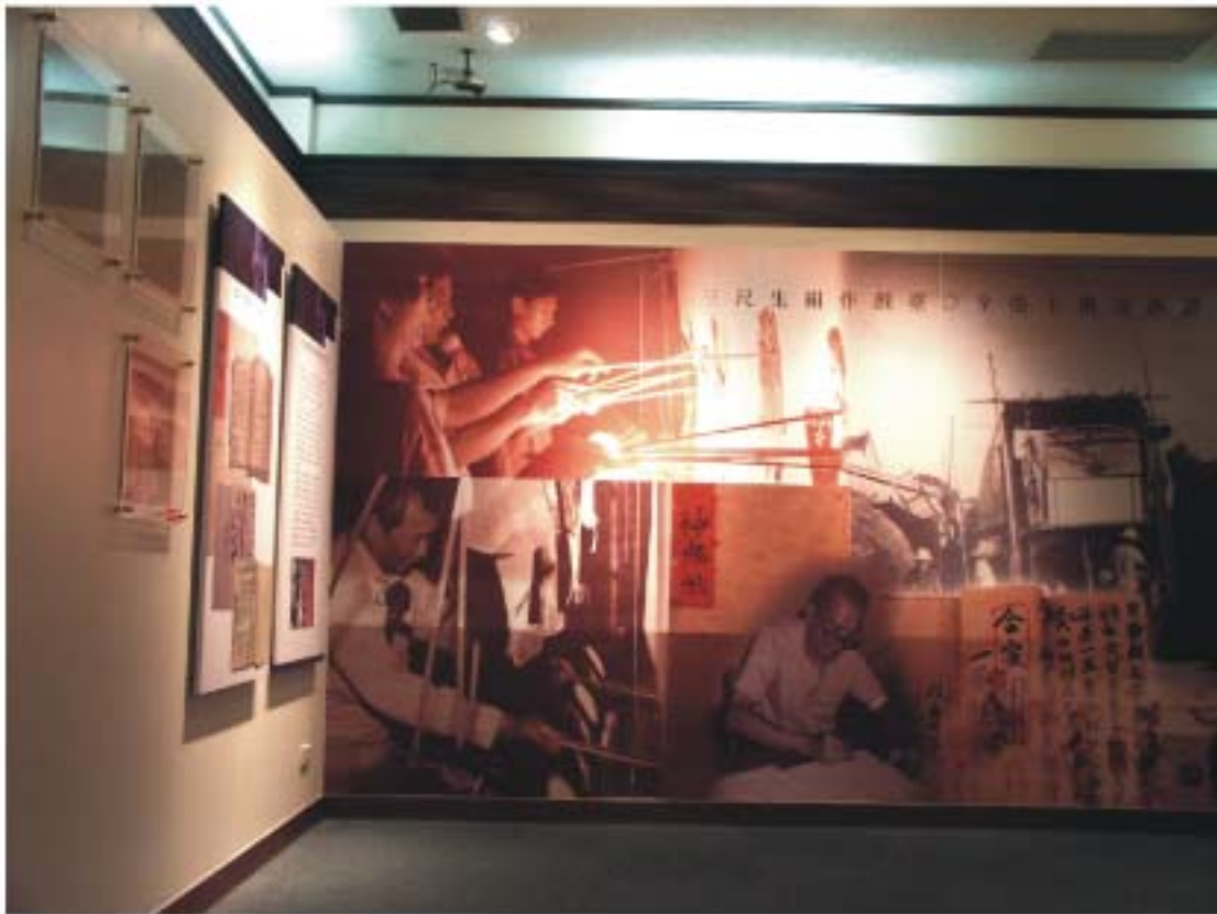
圖4.25 壁面噴畫(綜合影像)

大型壁面噴畫展示，內容有皮影戲藝師的後台演出情形、製作皮偶、劇本、野台演出等的綜合影像。