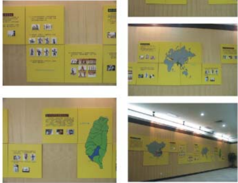
圖4.30 改裝前壁面展板