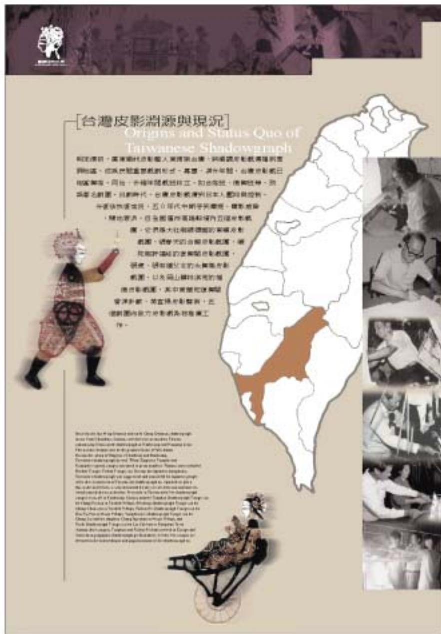
圖4.29 壁面展板(台灣皮影淵源與現況)

製作特色為底板部份以31鉛板為底材，表面施以不規則的磨砂處理，壁面辭架則以卯釘固定，並刻意露出卯釘頭，呈現出一種不同的粗曠美感。