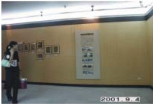
圖4.22 改裝前壁面展板(皮影戲的傳承與未來)

本壁面展板的展示內容，概要的介紹了高雄縣皮影戲館的建館背景，以及館內的設施、收藏、營運、演出、推廣計劃與傳習工作等。