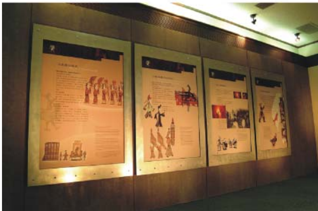
圖4.31 更新後壁面展板