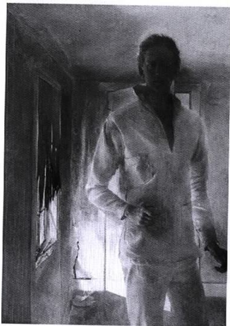
圖 20 『幽靈』1949