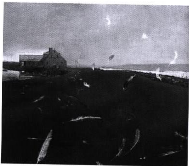
圖 19 『飄落』 1996