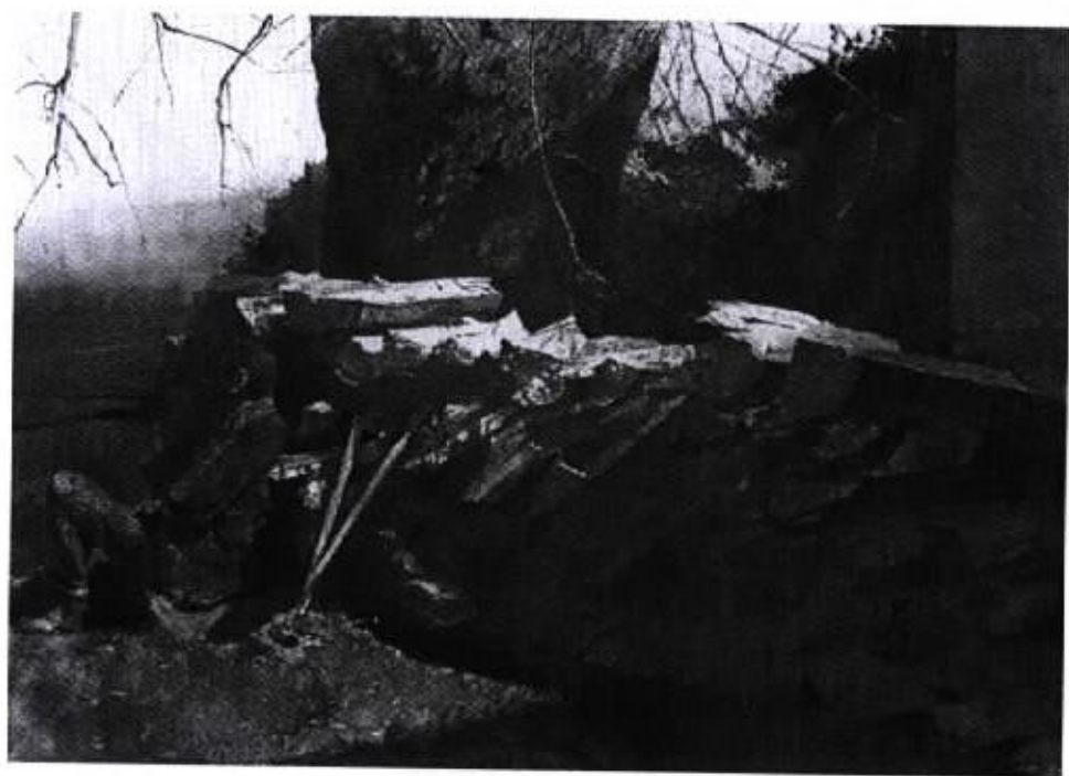
圖 18 『伐木工人』1964