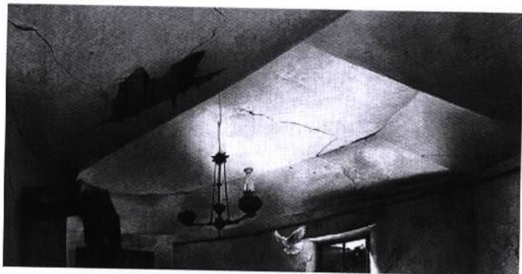
圖 21 『亞琪修女的教堂』1945