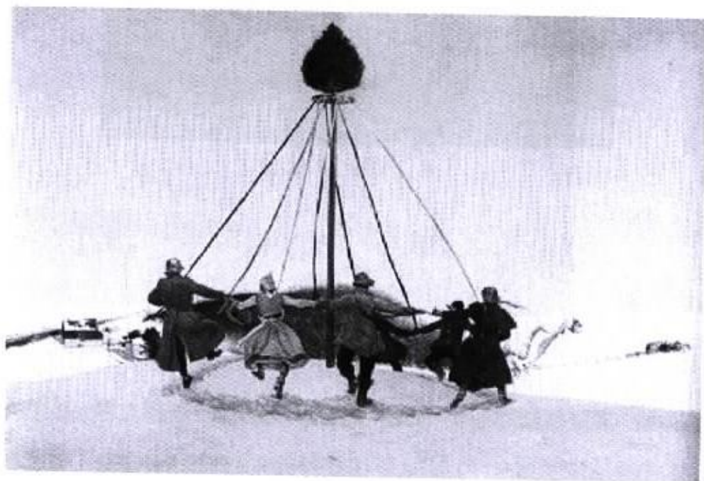
圖 22 『雪丘』1989

節奏具有條理性和重復性，帶有機械的美，但它僅是簡單的重複，而韻律是情調在節奏中起的作用，它是有“情調”的節奏。