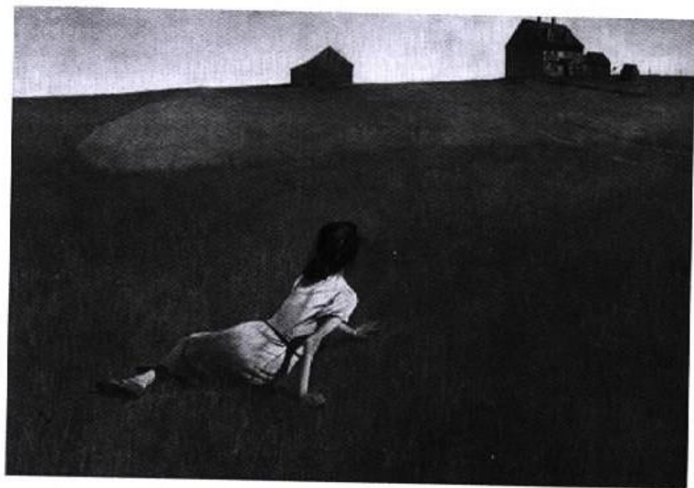
圖 16 『克麗絲蒂娜的世界』1948