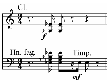
譜例 3-6 : m.147

第 145-150 小節同第 115-120 小節，鋼琴仍以變奏手法彈奏動機 a'，但技巧更爲精湛，而第一小提琴的撥奏改由雙簧管吹奏斷奏替代，伴奏部分不僅多了低音管吹奏琶音型，三角鐵的節奏型更由豎笛、法國號、低音管和定音鼓銜接演奏，配器和織度比 A 段和 A'段更爲豐富，可見李斯特在配器上的用心安排，讓相同樂段呈現不同色彩。(譜例 3-6)