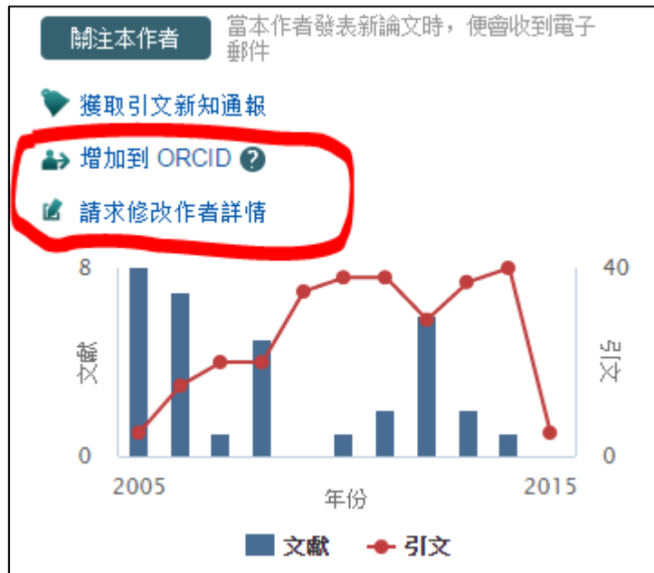
圖 4 利用 Scopus 維護學者 Profile