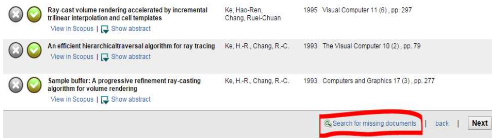
圖 8 請求修改作者詳情步驟三：搜尋遺漏的文獻