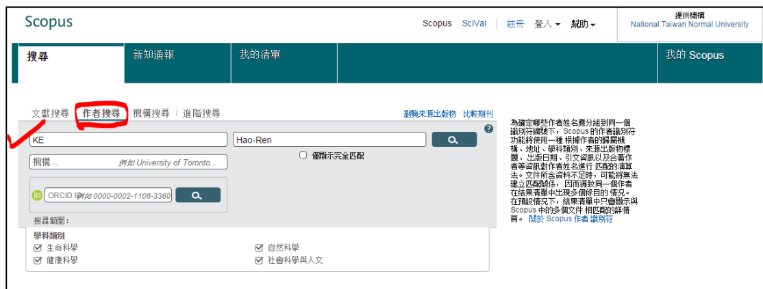
圖 1 Scopus 的作者搜尋功能