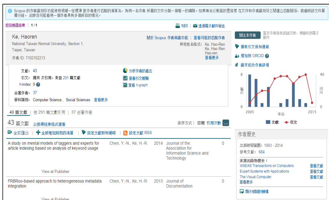
圖 3 作者詳情頁 – 生產力與影響力情形概覽