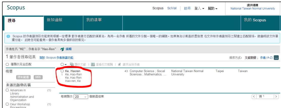
圖 2 作者搜尋結果