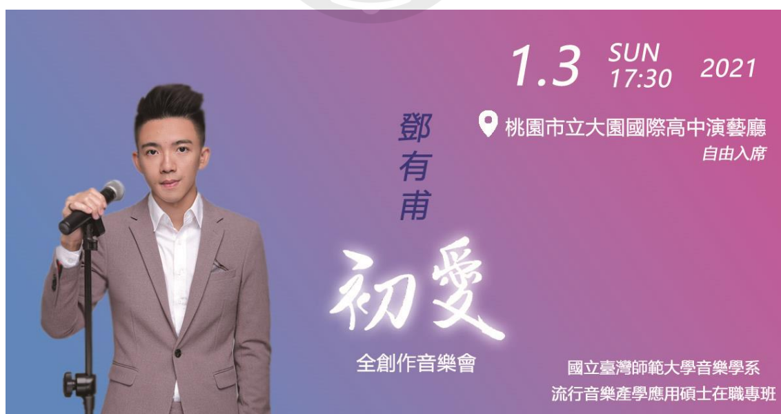
【圖 2】《初愛》音樂會之宣傳海報