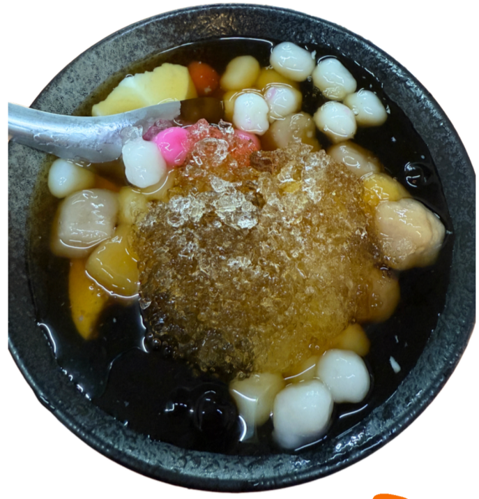
阿地桑豆花 推薦:冰豆花