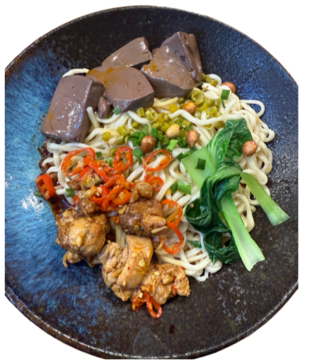
川方味-重慶酸辣粉.麵 推薦:重慶酸辣粉, 紅油抄手, 辣子雞拉麵