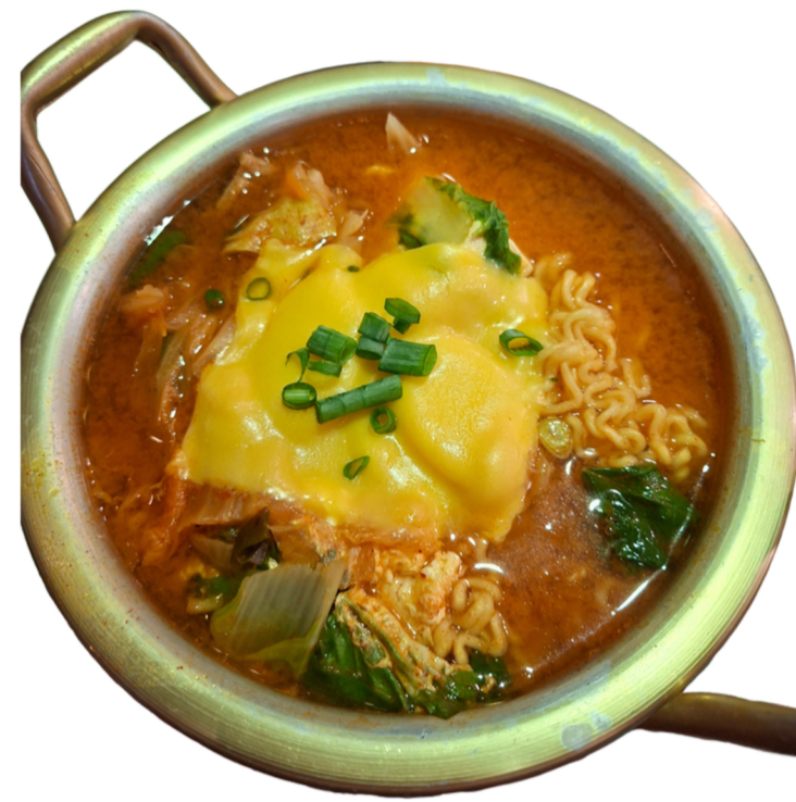
甲順伊韓式料理 推薦:韓式泡麵, 韓式部隊鍋