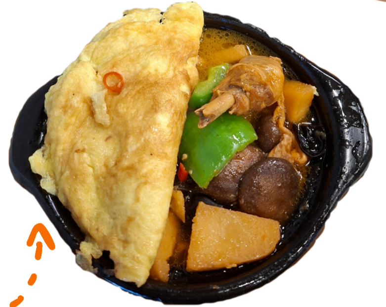
元爵味黃燜雞米飯 推薦:黃燜雞米飯, 乾鍋魷魚煲