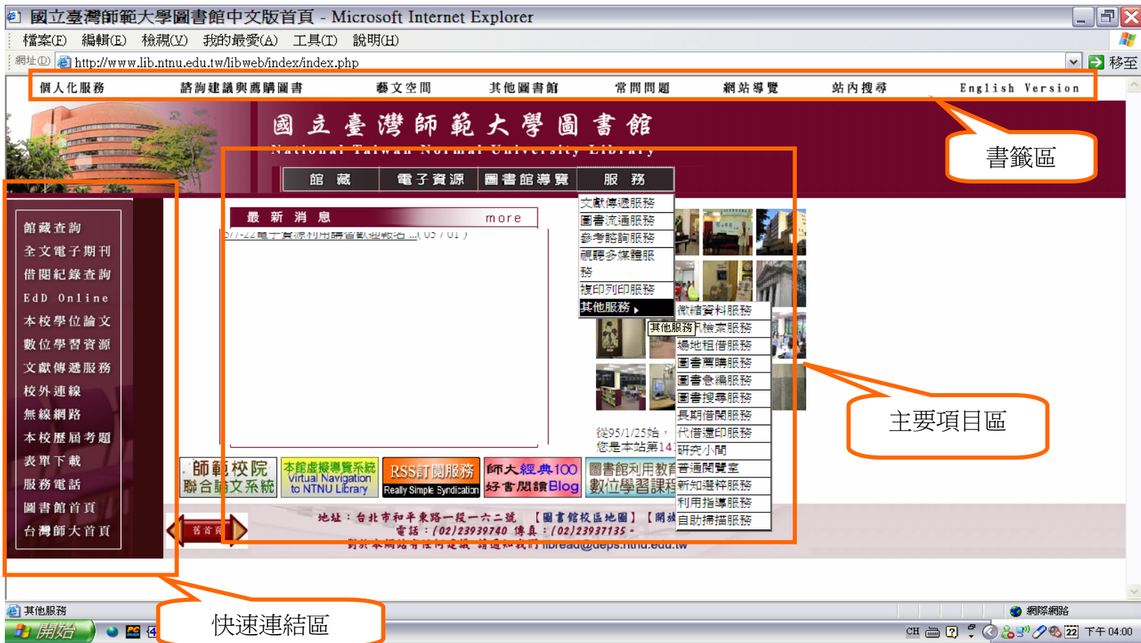
圖 3-2-1 國立臺灣師範大學圖書館網站